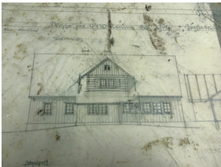
Nákres rozšíření školy na Hrnčířských Boudách – severozápadní pohled

Ze školy mi při nástupu nic nebylo protokolárně předáno, dostal jsem od předsedy MNV klíče od budovy a bylo hotovo. Škola byla celkově v hrozném stavu. Severní stěna budovy byla ztrouchnivělá, většina byla roubená bouda, která měla stará, ještě německá okna. Vzadu byly dvě kůlny, na uhlí a na dřevo. Na chodbě stál v mělké prohlubni kotel ústředního topení, který v zimě zbaštil velké množství hnědého uhlí. V koupelně ohříval ve velké válcovité nádrži vodu. Záchody byly dva v nevytápěné části budovy. Jeden pro školáky, druhý pro nás. Největší otrava byla obsluha „kotelny“ – vynášení popela, hlavně za větrného počasí – a také skládání 180 q hnědého uhlí se všudypřítomným prachem. To když inspektorka zjistila, málem ji kleplo. Dlužno poznamenat, že mi napsala výborné hodnocení, naprosto apolitické.