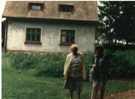
Návštěva po 50 letech