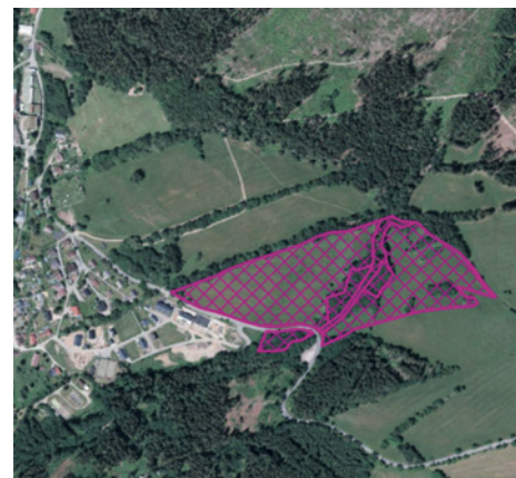
Mapka vykoupených luk

Další záležitostí, která se nás dotýká, je zpráva ze začátku října. Správa KRNAP v ní oznámila, že se jí podařilo vykoupit rozsáhlé luční pozemky nad Černým Dolem (77 000 m 2 za 6 milionů korun), kde měl původně vzniknout další apartmánový komplex. Díky tomuto zázraku zůstane toto místo i nadále domovem řady bezobratlých a zejména chřástala polního, který na těchto i sousedních pozemcích hnízdí.