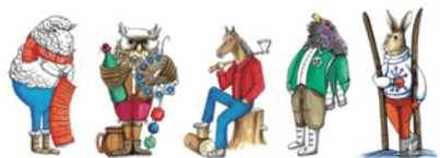
JSEM HORAL, TĚLEM I DUŠÍ