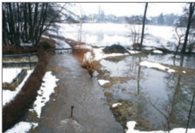
Obrázková vzpomínka na jarní tání v Olešnici. O. Nermut