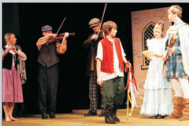
Touto inscenací rovněž nejmladší červenokosteletí herci dovršili 10 let spolupráce s ochotnickým souborem.