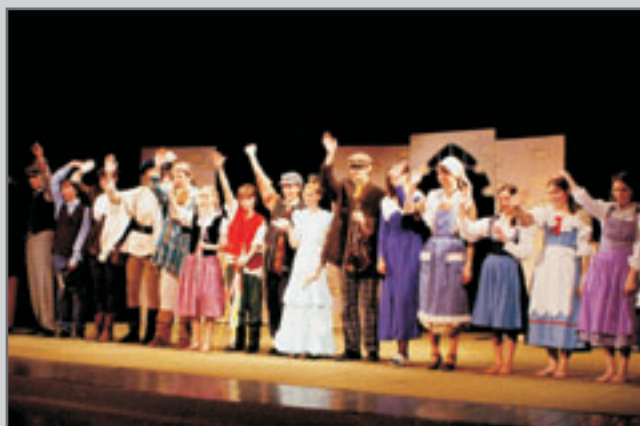
Premiéra 28. března, čtyři reprízy v následujících dnech. Pět "opon" po představení pro své spolužáky. O. Nermuť