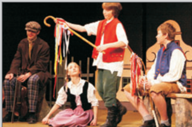
K. J. Erben - Jirka a kouzelná hůlka Literárně-dramatický kroužek ZŠ V. Hejny Červený Kostelec