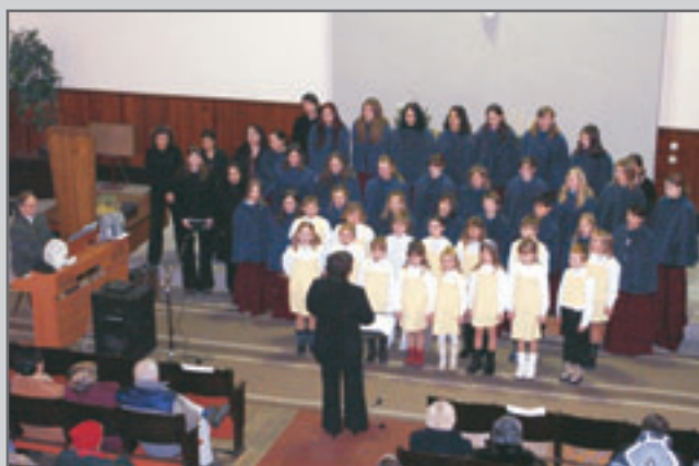
Zcela zaplněný kostel tleskal akordeonovému orchestru Musica Harmonica a pěveckému sboru Červánek.