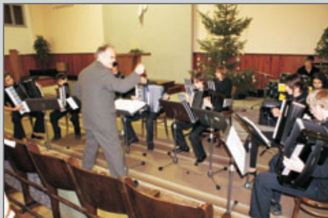
Poslední akcí k 25 letům ZUŠ byl Vánoční koncert v kostele československé církve husitské.