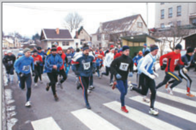
Čtyřicet závodníků, z toho osm žen, vyběhlo v sobotu 5. ledna na trať 32. Novoročního běhu v Horním Kostelci.