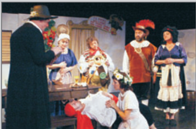
Miguel de Cervantes: Don Quijote aneb Veselý konec rytíře smutné postavy - Divadelní soubor MKS Č. Kostelec.