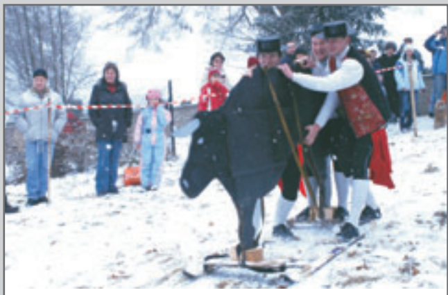
Španělští toreadoři rozdráždili byka a zahájili silvestrovský 7. Sjezd na čemkoli Na Prodance.