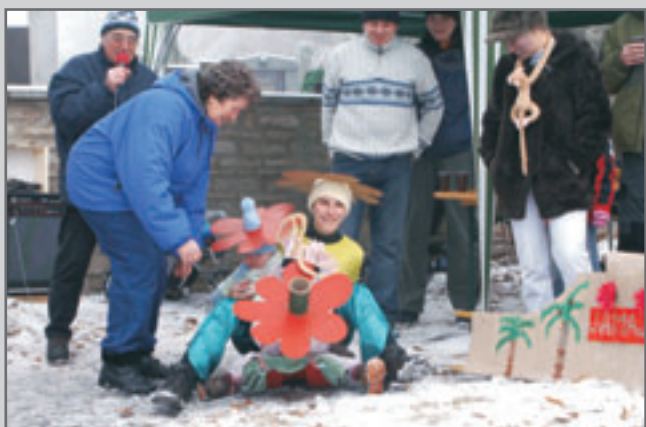
Více než sto diváků potleskem ocenilo také Rozkvetlé gerbery a Kokosy na sněhu.