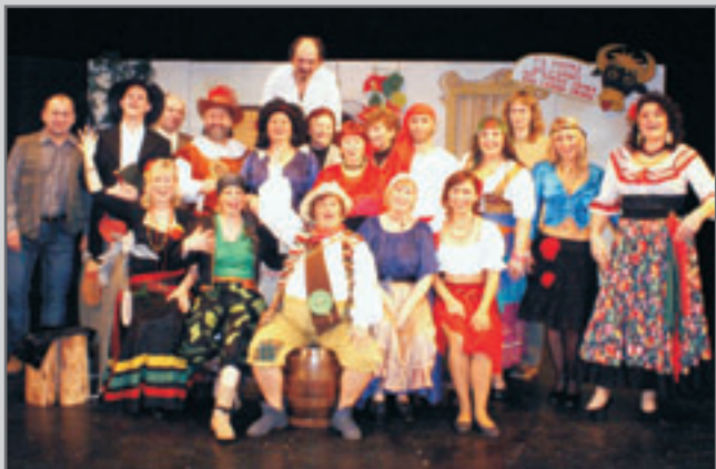
Červenokostelecký divadelní soubor se s touto inscenací představí i při letošním divadelním festivalu. O. Nermuť