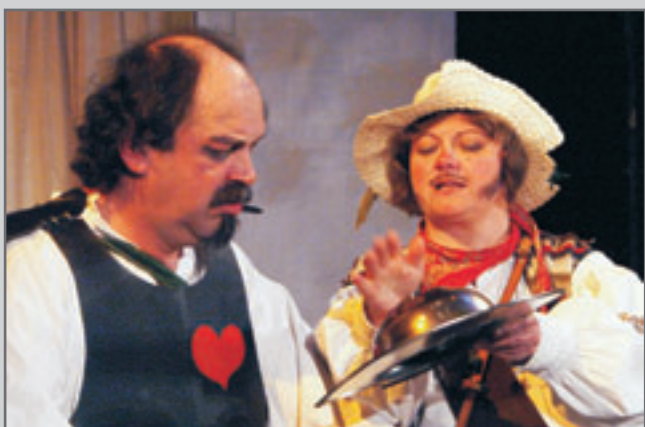
Pan Klepáček se pokusil dopřát Donu Quijotovi veselejší odchod ze scény, než jaký mu napsal pan Cervantes.