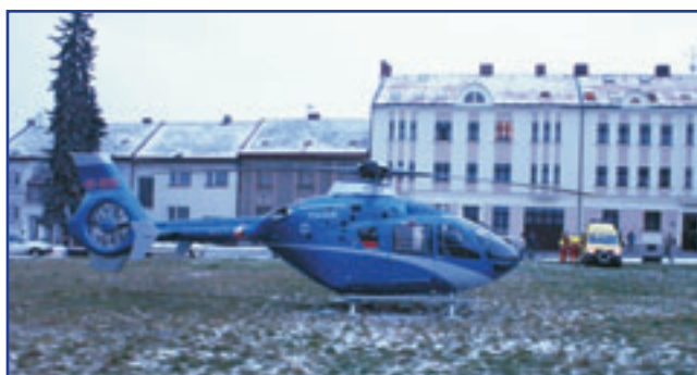
Záchranáři v akci.