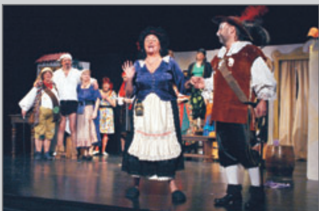
Při premiéře 22. 12. a repríze 26. 12. 2007 se dobře bavilo zcela zaplněné hlediště Divadla J. K. Tyla.