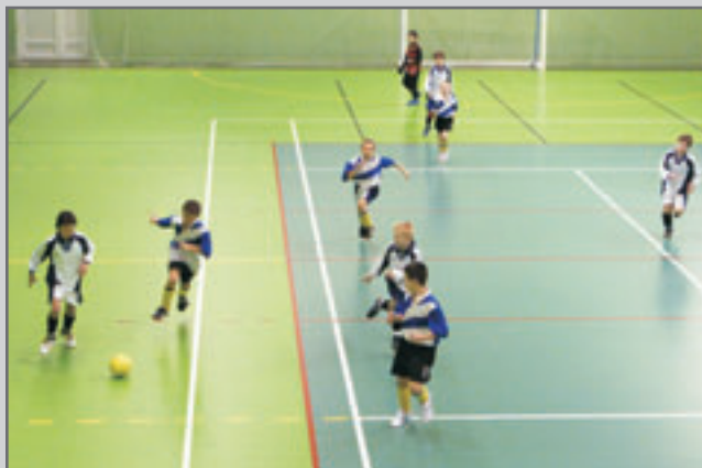
V zimním turnaji starších přípravek skončilo domácí "áčko" čtvrté, "béčko" bylo šesté.