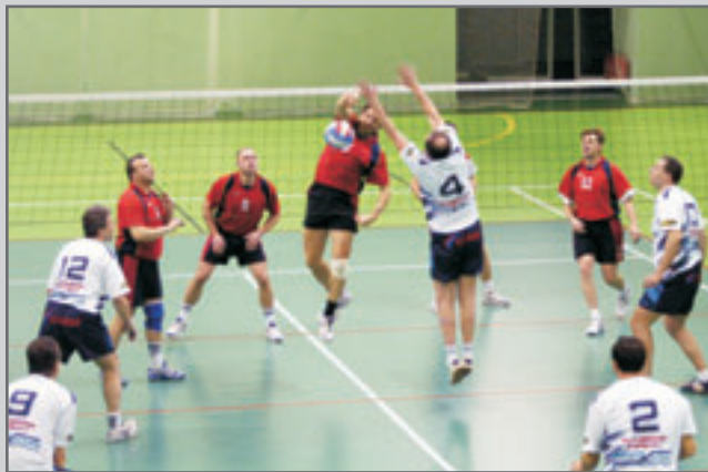
Fotografie jsou i pozváním na poslední domácí utkání krajského přeboru I. třídy 8. a 15. března. O. Nermut