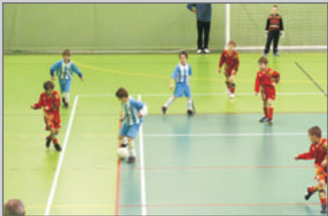
10. ročník zimního turnaje mladších přípravek 2. února. Vyhrál Broumov A, domácí (v červeném) skončili čtvrtí.