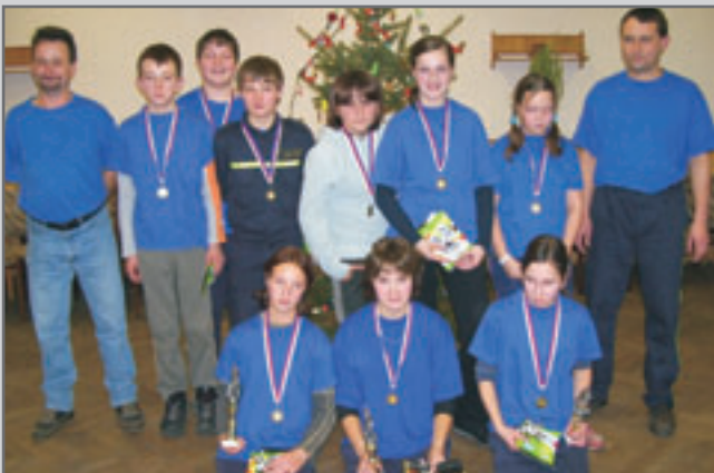
Úspěšný kolektiv starších žáků SDH Stolín, o jehož aktivitách se píše v článku Nejvšestrannější mladý hasič. -JV-