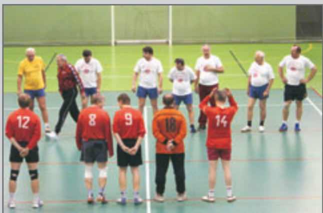
V zimním turnaji starých gard mužů v národní házené domácí tým skončil čtvrtý.