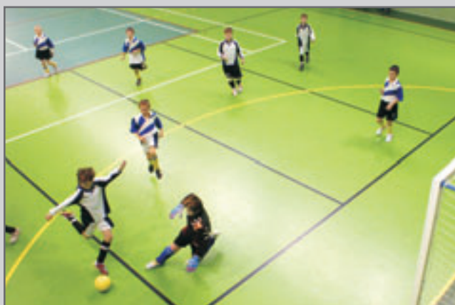
Fotografie ze zimního turnaje starších přípravek je z derby Červený Kostelec A - Červený Kostelec B 1:0.