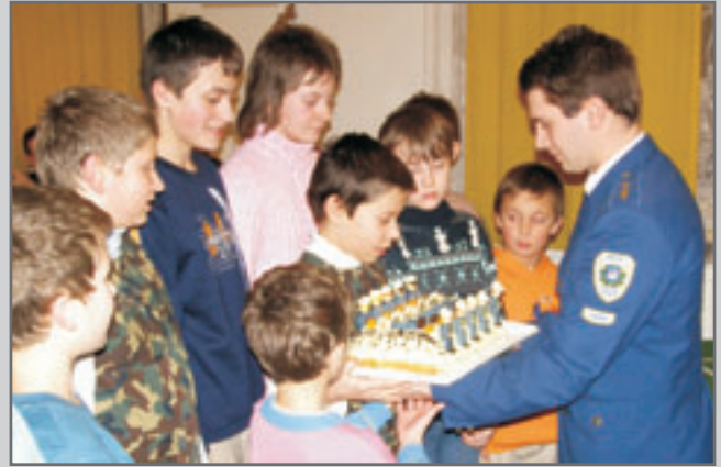
Aktivní a úspěšná činnost mladých hasičů SDH Lhota byla při výroční schůzi oceněna dortem.