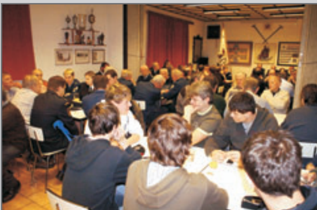
Svou bohatou činnost v loňském roce zhodnotili a novou naplánovali při výroční schůzi členové SDH Červený Kostelec.