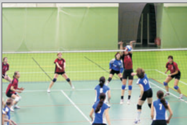
Krajský přebor I. třídy mužů i žen Č. Kostelec - Náchod. Ženy 3:2 a 3:1, muži 3:0 a 3:0.