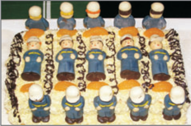
Mladí hasiči SDH Lhota ve sladkém dortovém provedení i s přesným počtem členů.