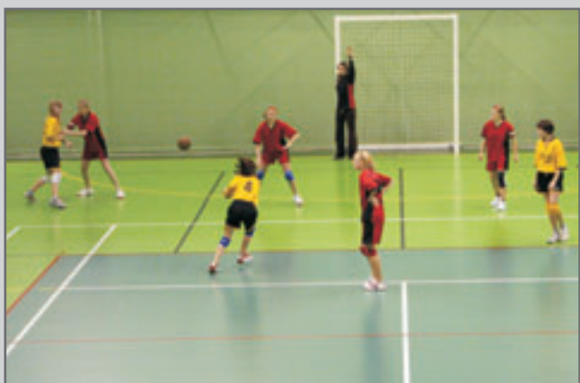
Fotografie domácího útoku i obrany jsou z utkání Červený Kostelec - Hlinsko A 4:5.