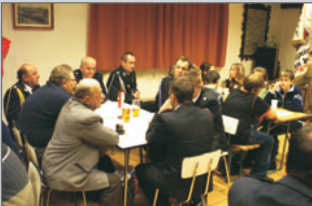
Za přítomnosti přátel z polského Stolce také červeno-kosteletští hasiči ocenili práci s mládeží. -ON-