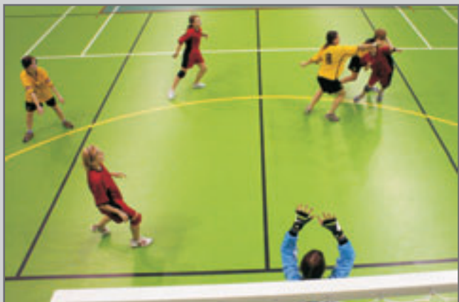
Národní házená. Zimní halový pohár starších žákyň uspořádal červenokostelecký oddíl národní házené koncem ledna.