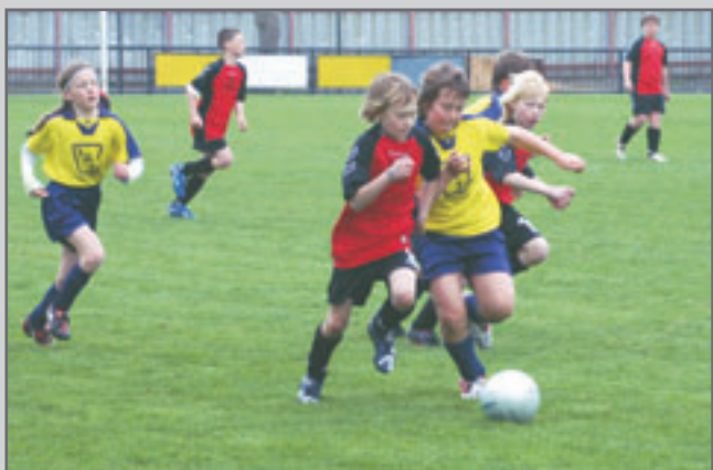
V dramatickém závěru utkání Červený Kostelec - Vrchlabí uhájili domácí těsné vítězství a radost byla veliká.