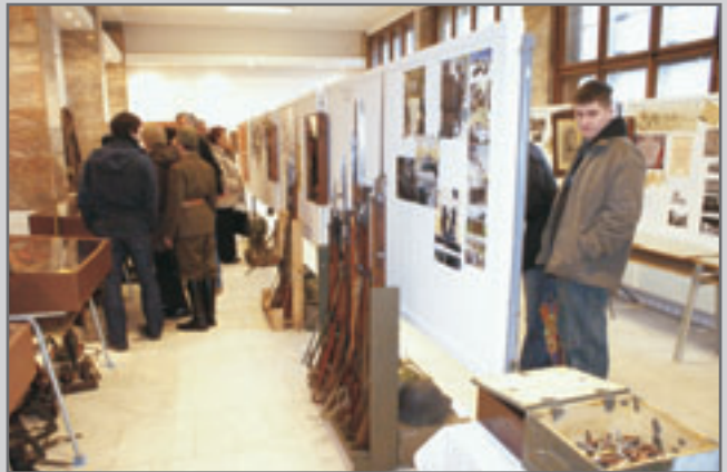
Výstavu Českoslovenští vojáci uspořádal Klub vojenské historie T - S 26 Odolov a MKS Červený Kostelec.