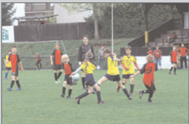
Seďm branek viděli diváci při utkání mladších žáků Červený Kostelec - Vrchlabí 4:3 po poločase 4:1.