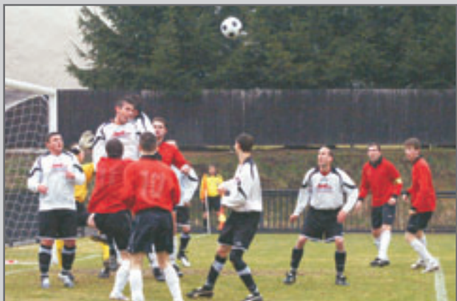
Červenokostecké áčko ve svém prvním jarním utkání na domácím hřišti porazilo Doudleby 5:0.