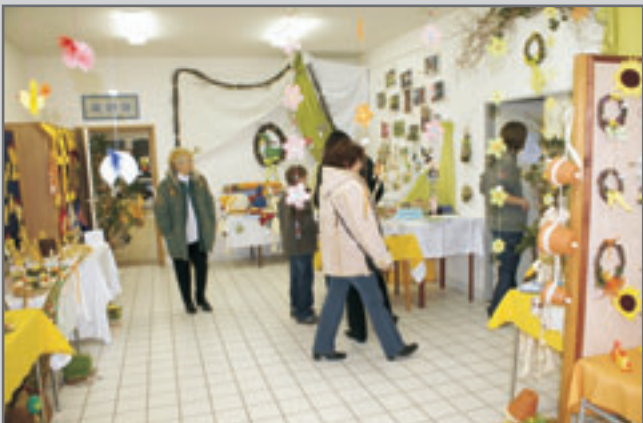
Mnohé velikonoční výrobky zakoupené na této výstavě vytvořily v domovech návštěvníků sváteční atmosféru.