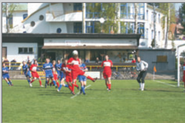
Červený Kostelec B - Nové Město nad Metují 0:5 po nadějném poločase 0:0.