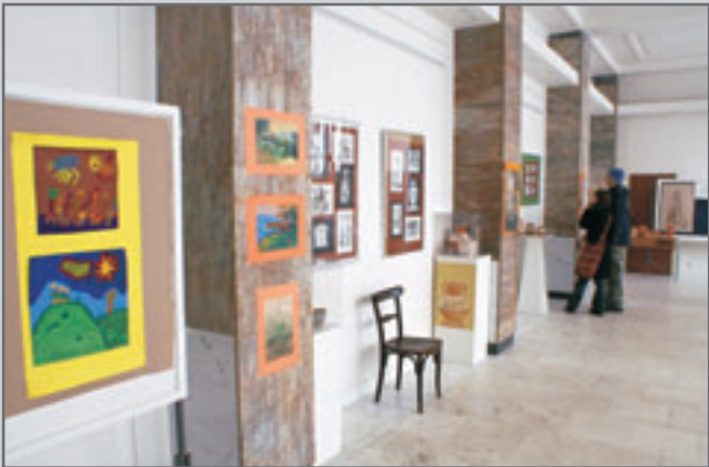
Výstava prací žáků výtvarného oboru Základní umělecké školy Červený Kostelec "Umění jako pohazení..?"