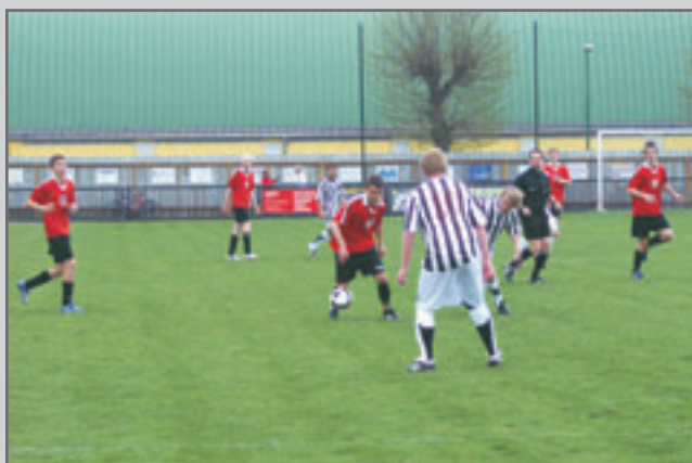
Starší dorost Červený Kostelec - Slovan Broumov 1:1, poločas 0:0.