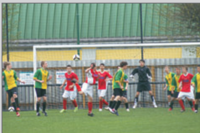
Mladší dorost ve žlutozelených drezech zvítězil nad Slovanem Broumov 2:0 po poločase 1:0.

NA FOTBALE U NÁS - STADION TJ ČERVENÝ KOSTELEČ