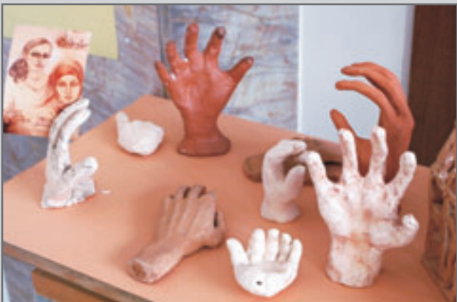
Dětská tvorba je čistá a plná energie a je pohazením pro duši.