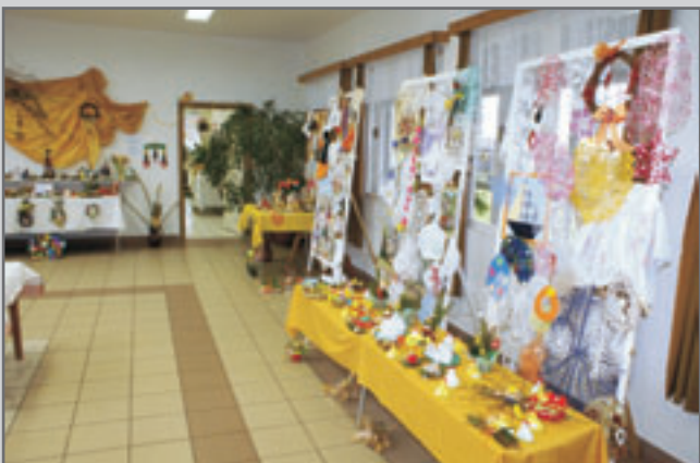
Velikonoční výstavu v DPS U Jakuba věnovanou Hospici Anežky České navštívily stovky diváků.