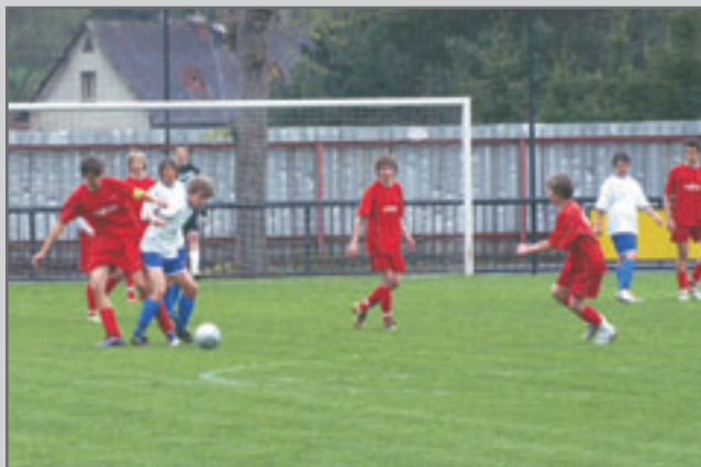
Mistrovské utkání starších žáků Červený Kostelec - Vrchlabí skončilo 0:1 po poločase 0:0.