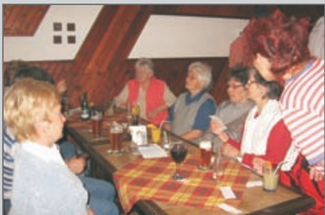
Dne 24. března 2010 se konala výroční valná hromada TJ Sokol Červený Kostelec