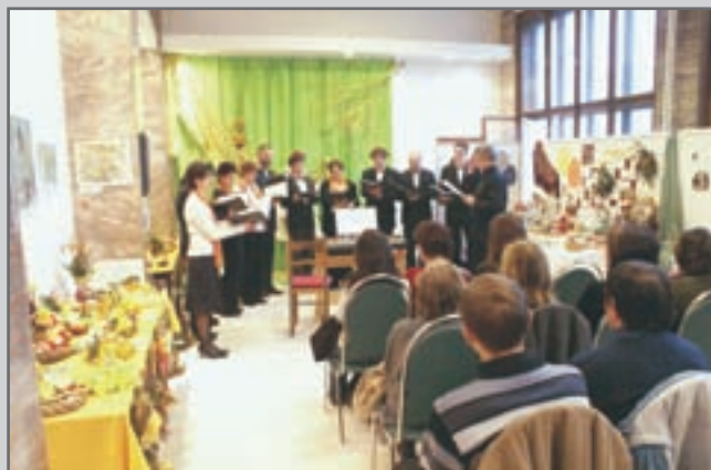
Velikonoční výstavu věnovanou Hospici Anežky České v Červeném Kostelci