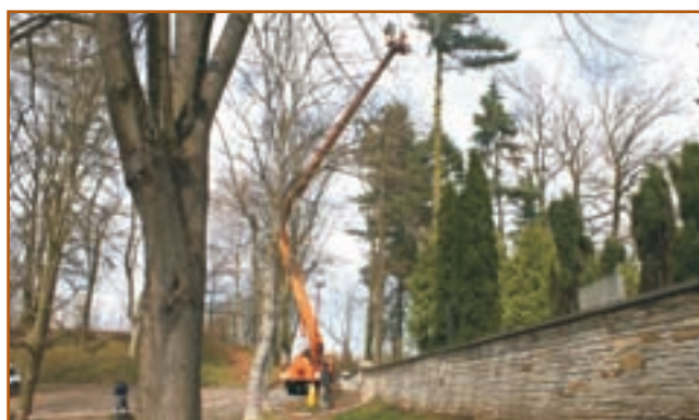
Fotografie jsou z revitalizace zeleně na hřbitově v urnovém háji (nahore) a u hřiště na házenou (dole). -ON-