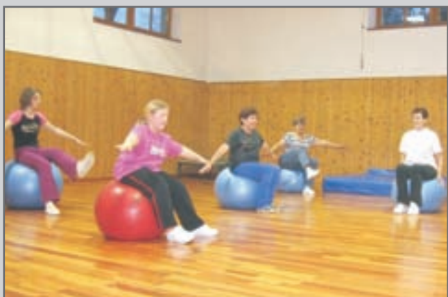
Každý čtvrtek se v malém sále sokolovny koná cvičení s fitbally a overbally