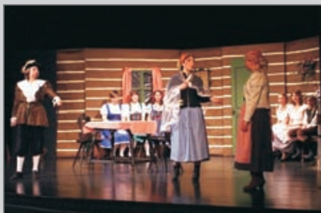
Žáci 8. ročníku literárně-dramatické výchovy při ZŠ Václava Hejny Červený Kostelec Vás pozvali na pohádku.