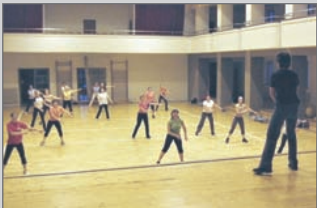
TJ Sokol Červený Kostelec v tělocvičně a na výroče. Pravidelné středeční kondiční cvičení žen.