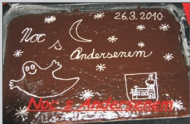
Noc s Andersenem v Městské knihovně v Červeném Kostelci