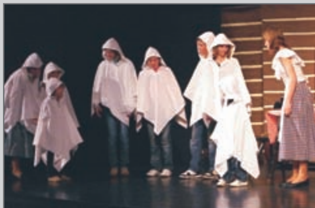
Pohádka MOUDRÁ ŠEVCOVÁ