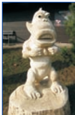
Vodník Brodík a jeho spolupracovníci

Nezapomeňte se také přijít podívat na nové sochy, které budou v průběhu jara instalovány pro vaši radost a potěšení v areálu kempu. Těšit se již můžete i na občerstvení v naší Vodnické restauraci. Ta bude v květnu otevřena pravidelně každý víkend a v případě pěkného počasí i ve všední dny. Přejeme vám krásný květen plný slunce, lásky a dobré nálady. Na viděnou u nás, na Brodském.