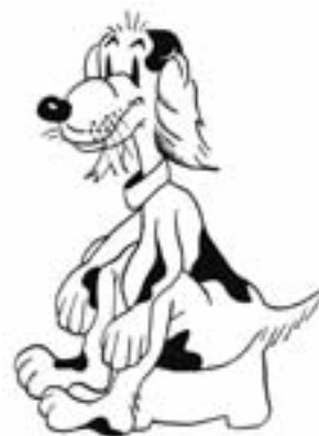
Kresba: Věra Věčelšová

Chovatelé psů, mějte ohled na ostatní a uklízejte po svých zvířecích favoritech.