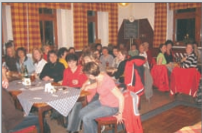
Za hojně účasti členů a členek Sokola byl zvolen nový výbor, který povede Sokol do roku 2013.