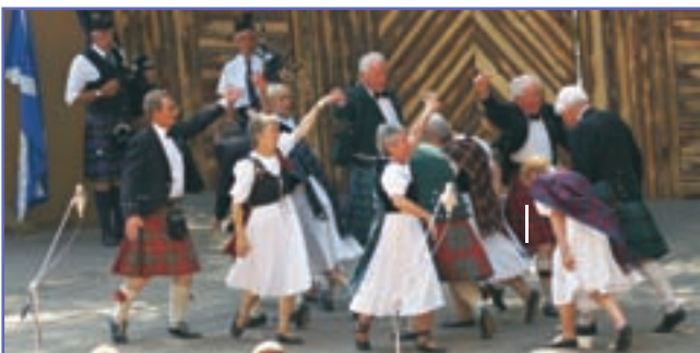
Folklorní festival je minulostí