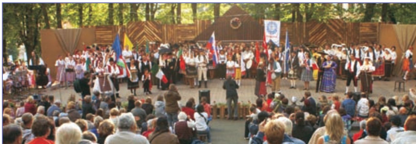
Tak začal a tak skončil 56. Mezinárodní folklorní festival Červený Kostelec 2010.