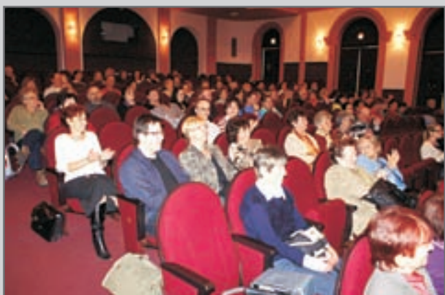
Skvělí červenokosteckí diváci přicházeli do divadla ve velkém počtu dopoledne, odpoledne i večer.