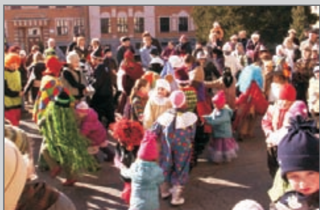
Hrálo, zpívalo a tančilo se u sokolovny, u škol a na červenokosteleckém náměstí.