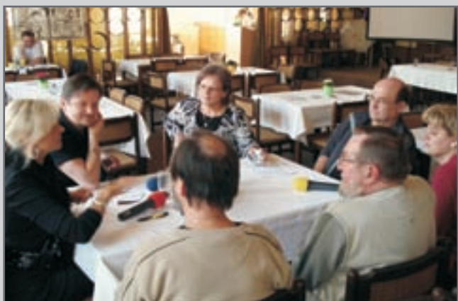
Český rozhlas Hradec Králové po celé páteční dopoledne vysílal „Péháčko“ z malého sálu Divadla J. K. Tyla.