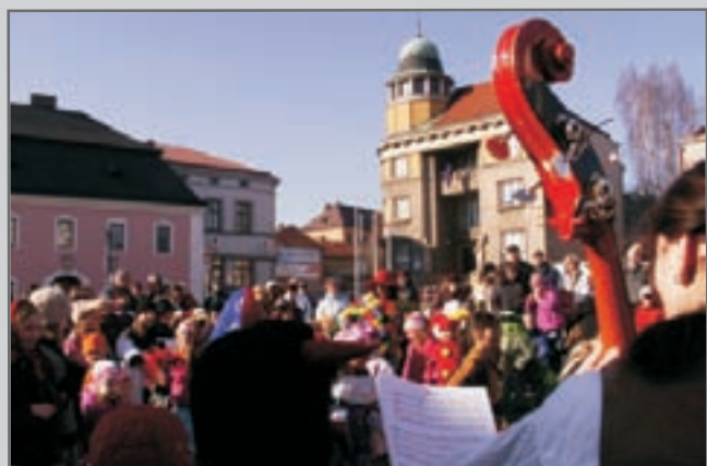
Masopustní veselí.