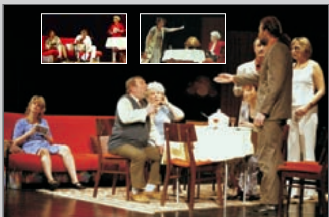
Červenokostecký Divadelní soubor NA TAHU byl oceněn velkým potleskem za inscenaci Josefa Berana Aut.