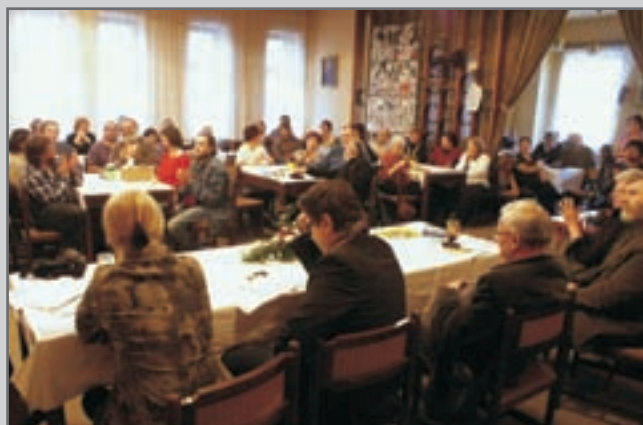
V nedělním pozdním odpoledni porota prozradila výsledky a přítomní poděkovali červenokosteckým organizátorům.