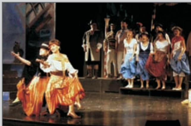
Sousedé z Divadelního souboru Jiráskova divadla Hronov pobavili červenokostecké publikum v sobotu večer.