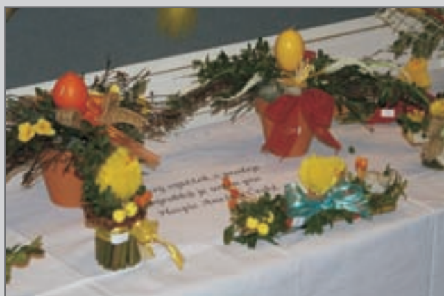
Výrobky inspirované jarem a velikonočními svátky si přicházeli prohlédnout a zakoupit četní diváci.