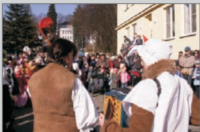
U příležitosti masopustního veselí prošel pro obveselení měšťanů průvod tradičních i netradičních masek.