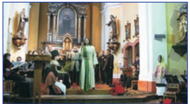
ŽIVÉ PAŠIJE - dramatické a hudební ztvárnění Ježíšova umučení v podání mladých herců a hudebníků fotografoval Patrik Rosa.

Internetové stránky: tp://ckostelec.ccshhk.cz