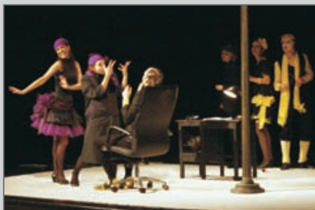
Závěr divadelní přehlídky patřil Moliérovu Lakomci v originálním provedení Geisslers Horcomodianten.