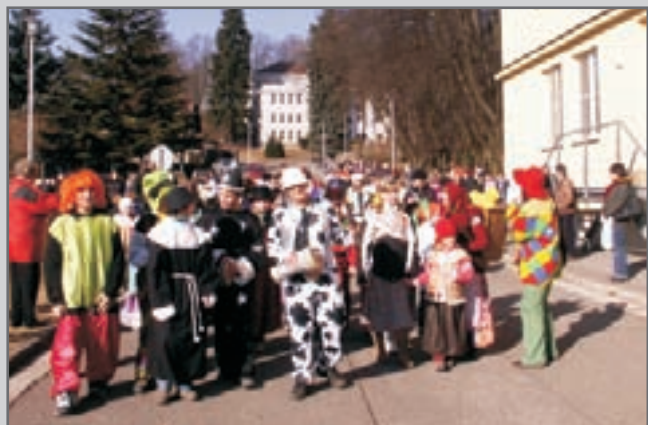
8. března 2011 Masopustní úterý v Červeném Kostelci.