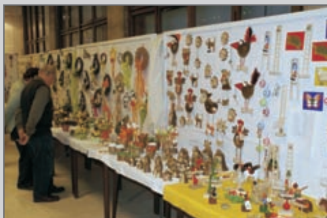
Poděkování pořadatelů patří všem autorům vystavených uměleckých děl. Oldřich Nermut