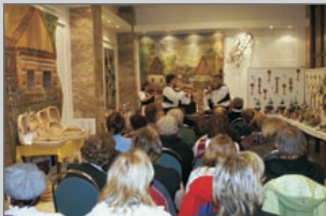
Jaro začalo prodejní Jarní výstavou věnovanou Hospici Anežky České v Červeném Kostelci.