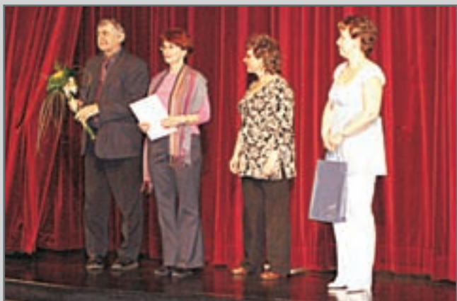
Je zahájeno! Během čtyř dnů diváci zhlédli dvanáct divadelních inscenací.