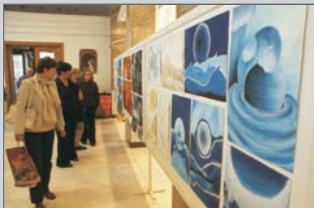
Téma z pohádek, bájí, mýtů, ale i skutečných příběhů zpracovávali žáci školy téměř dva roky.