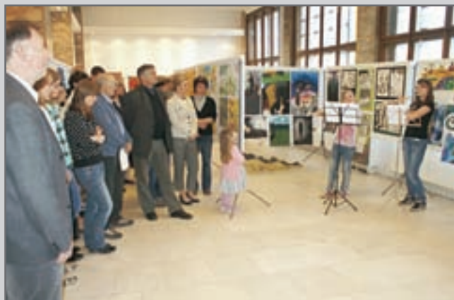
Výstava výtvarných prací žáků ZŠ V. Hejny Ze starých příběhů.