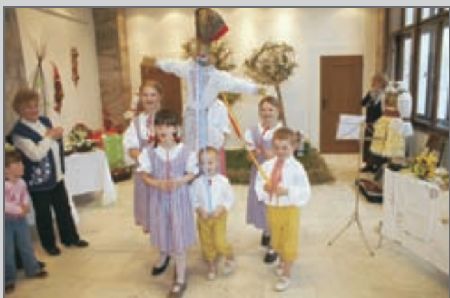
Při vernisáži svým vystoupením expozici umocnil a přítomné svátečně naladil folklorní soubor Hadárek.