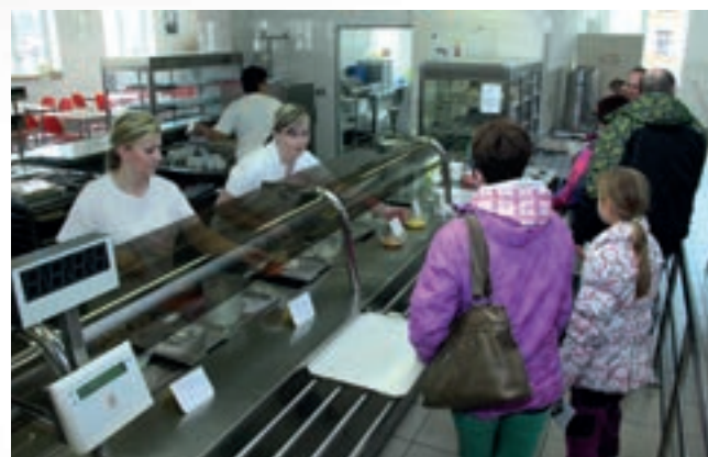
Den otevřených dveří ve školní jídelně nám umožnil podívat se, v jakých prostorách vaří kolektiv kuchařek obědy. Jídlo není určeno pouze pro žáky, ale může si je objednat i kdokoliv jiný.