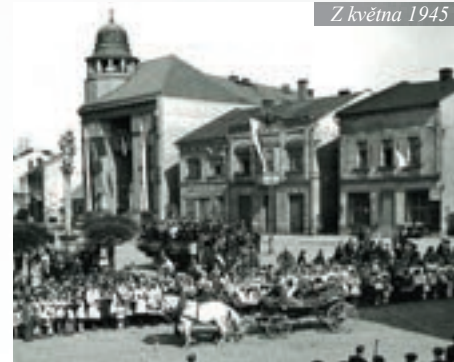
Z května 1945

Z rozhlasu se lidé v Červeném Kostelci dověděli o příchodu sovětských vojsk do Prahy. K nám do města Rudá armáda přišla