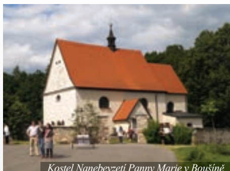
Kostel Nanebevzetí Panny Marie v Boušíně