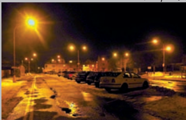
Miloš Knapovský: Aut. nádraží navečer