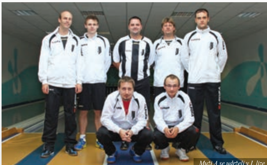
Muži A se udrželi v I. lize