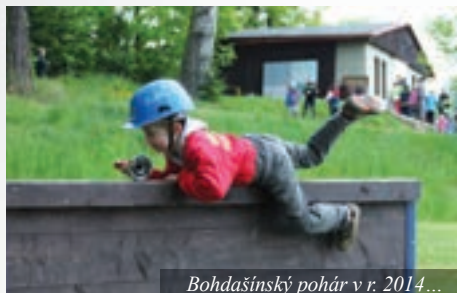
Bohdašínský pohár v r. 2014...

Po celou dobu soutěže je zajištěné občerstvení. Přijďte podpořit mladé hasiče. Srdečně zvou pořadatelé.