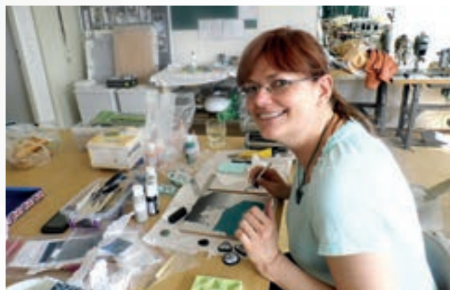
11. dubna proběhlo – v inspirativním prostředí Střední školy oděvní, služeb a ekonomiky – tzv. fimohraní. Deset zájemkyň se při něm naučilo, jak správně zpracovat polymer a vytvořit si z něj šperk.