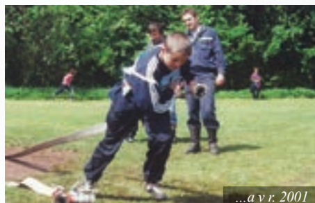
...a v r. 2001

Zveme všechny absolventy kroužku – ročníky narození 1997 a starší. Připraven je hasičský program, sportovní oblečení s sebou. Hlaste se předem na č. 724 079 548 nebo na e-mail havel.jarda@seznam.cz do 10. května.