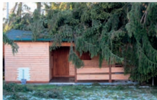
Doslova paseku udělal především v areálu kempu u rybníku Špinka, kde skácel na 50 stromů. Odtud také pocházejí tyto snímky.