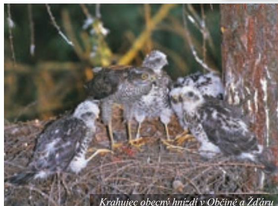
Krahulec obecný hnízdí v Občině a Žďáru

Obliba ptáků mezi lidmi má dlouhou tradici a důvody hledejme v jejich vzhledu, zpěvu a chování. Doklad o tom, že ptáky milovali už naši otcové a dědové, najdeme i v historických materiálech o našem městě. V turistickém průvodci Letovisko Červený Kostelec od Josefa Hurdálka z roku 1940 najdeme v bodovém popisu mapky se zajímavostmi města: „13. Chrby – krásný výhled – ptačí rezervace.“ V textu další informace chybí, ale snad se mezi místními pamětníky najde někdo znalý důvodu označení této lokality za rezervaci ptáků. Za jakékoliv informace budeme vděční.