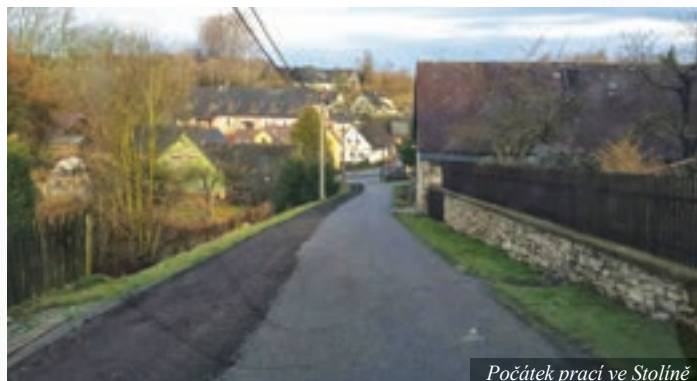
Počátek prací ve Stolíně

vrhovanou protlakovou technologii. Dle návrhu projektanta se v tomto úseku provede ruční výkop a v částech, kde to bude možné, se použije malá strojní technika. Na kontrolním dni 8. dubna 2015 bylo dohodnuto, že dodavatel stavby upraví harmonogram prací vzhledem k novým skutečnostem a změnám technologického postupu prací.