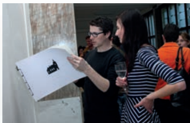
Návrhy studentů architektury na možnou zástavbu prostoru autobusového nádraží a přilehlé travnaté plochy jsme si mohli v dubnu prohlédnout ve výstavní síni MěÚ.