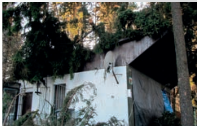
V úterý 31. března ve večerních hodinách způsobil na řadě míst Červeného Kostelce a nejbližšího okolí velké potřeze silný vítr.