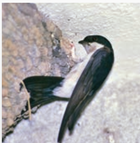
Jiříčka obecná hnízdí u Bedny a řídce i jinde