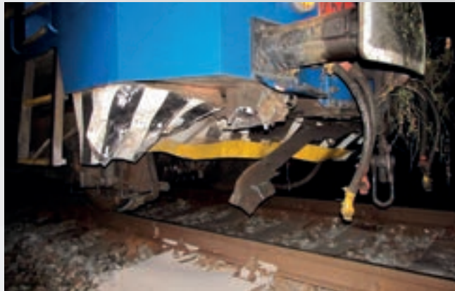
Vedle Špinky vítr shodil také několik stromů na jiných místech. Jeden z kmenů padl i na železnici, kde ho přerazil jedoucí vlak (viz foto vpravo). Nehoda se naštěstí obešla bez zranění.