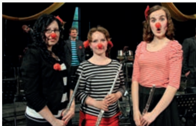
Přijel k nám cirkus! Městská dechová hudba představila téměř plnému hledišti Divadla J. K. Tyla veselé pásmo skladeb a cirkusových vystoupení.