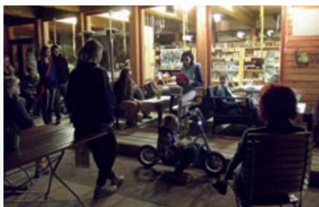
Na několika místech města jsme mohli 13. května v rámci Noce literatury slyšet nejnovější texty současných evropských autorů.