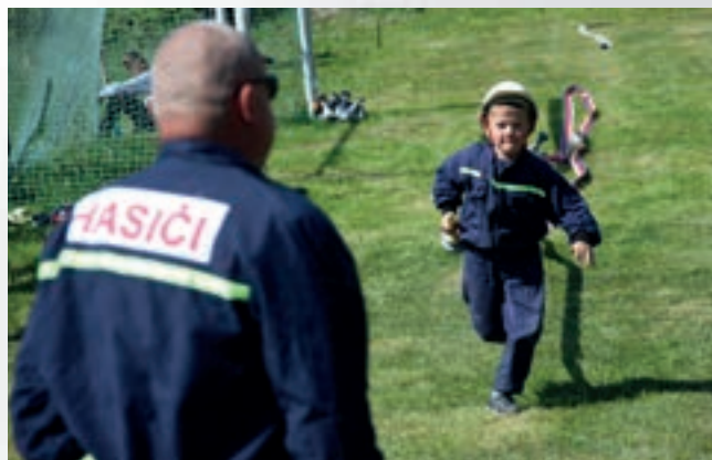
Dalšího ročníku Bohdašínského poháru se v sobotu 16. května zúčastnily přes tři desítky mládežnických družstev.