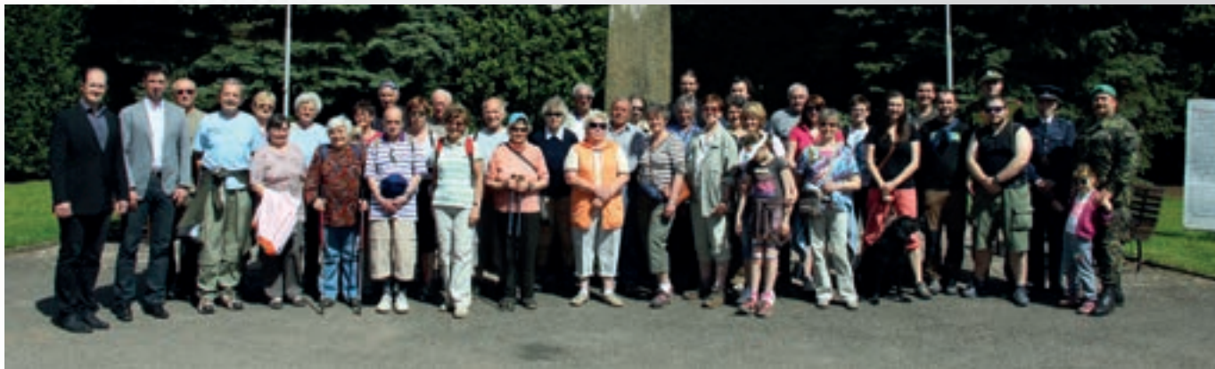
Vydařené akce se za krásného počasí zúčastnilo přes 40 lidí.