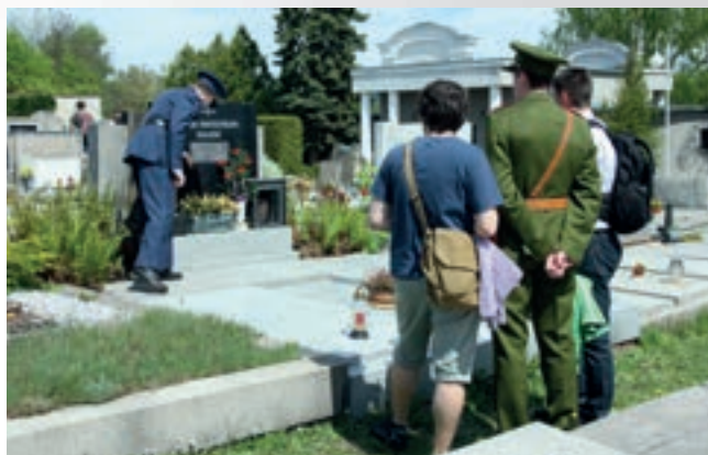
Další akcí uspořádanou v rámci 70. výročí od konce 2. světové války byla vzpomínková vycházka v režii Klubu českých turistů.