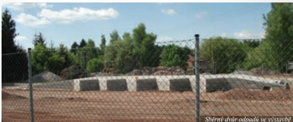
Sběrný dvůr odpadů ve výstavbě

Předpokládáme, že díky sběrnému dvoře dojde k zefektivnění sběru a třídění