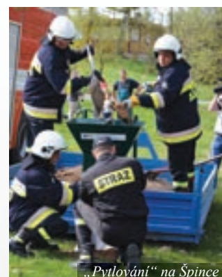
„Pytlování“ na Špince

ského Tarnowa a našich SDH Červený Kostelec, Lhota a Stolín si vyzkoušeli dostupnou techniku, která se používá při odčerpávání vody ze sklepů a dalších prostor, naučili se plnit dvoukomorové protipovodňové pytle a stavět z nich hráze a procvičili si záchranu tonoucího. Celé akce se zúčastnily vyjma hasičů také další složky integrovaného záchranného systému.