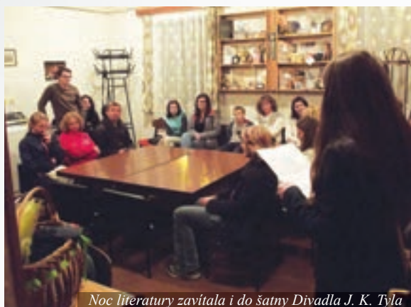
Noc literatury zavítala i do šatny Divadla J. K. Tyla