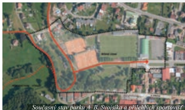
Současný stav parku A. B. Svojsíka a přilehlých sportovišť