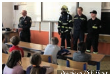
Beseda na ZŠ V. Hejny

Cvičení zásahů při povodních proběhlo 25. dubna v odpoledních hodinách v kempu u rybníku Špinka. Hasiči z pol-