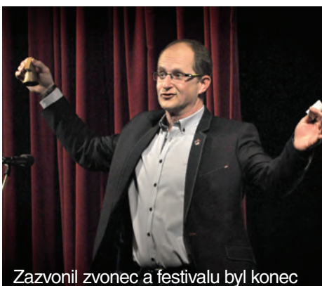
Zazvonil zvonec a festivalu byl konec

Kvalitu a provedení hodnotila odborná porota, která neměla lehký úkol. Vybrat toho opravdu nejlepšího a nikoho nepoškodit, není moc lehké a jednoduché. Konečný verdikt poroty byl ale nezvratný. Na celostátní přehlídku Divadelní piknik Volyně byly doporučeny inscenace „Poslední doutník“ a