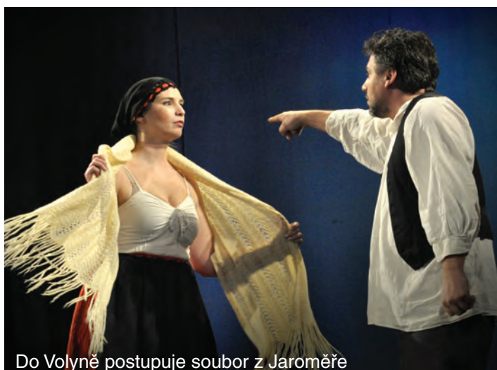
Do Volyně postupuje soubor z Jaroměře