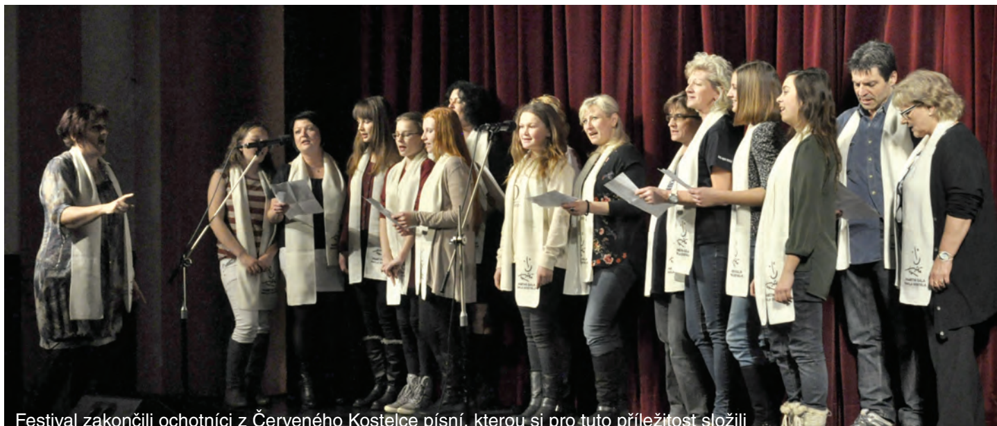
Festival zakončili ochotníci z Červeného Kostelce písní, kterou si pro tuto příležitost složili