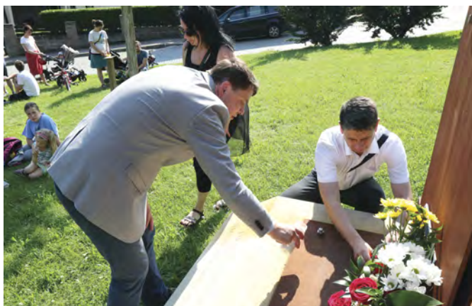
Výroční den její popravu si připomenuli představitelé města a občané u památníku obětem komunismu pod sokolovnou.