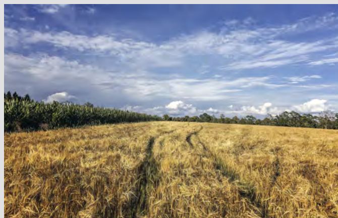
Libor Černožorský: Obilí