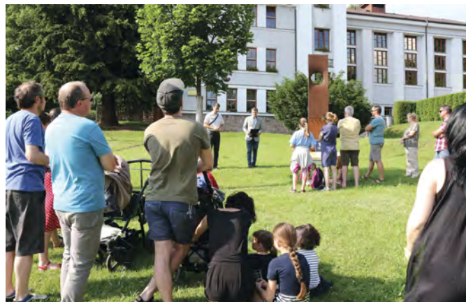
V sobotu 27. června 2020 uplynulo 70 let od popravu političky, právničky a odvážné ženy Milady Horákové.