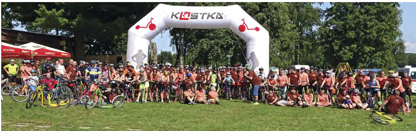
Druhý zářijový víkend se v kempu Brodský konal již 7. ročník srazu koloběžkářů.