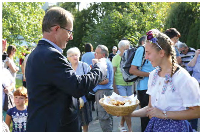
Po krátkých zastávkách průvod pokračoval do restaurace Na Maltě, kde byl připraven kulturní program.