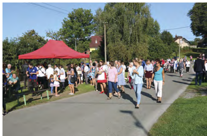
Obnovená tradice pořádání posvícení ve velkém se ve Lhotě vyvedla. Účastníci vyšli v hojném počtu z křižovatky u lípy ve Lhotě.