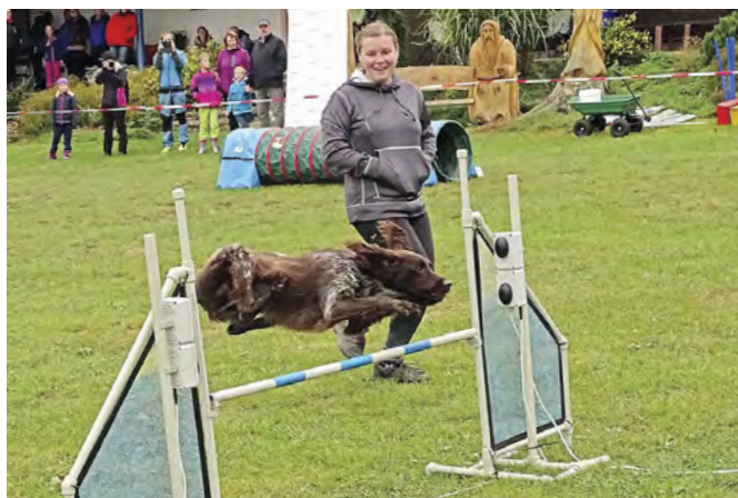
V neděli 27. září se v areálu kempu Brodský konal již třetí ročník neoficiálních agility závodů Brodíkův speciál.