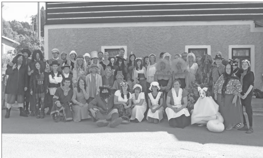
Společná fotografie pohádkových bytostí – patronů horských obcí. Více fotografií naleznete na www.obec-destne.cz/fotografie/kacencino-loucení-s-letem/kacenska-2013