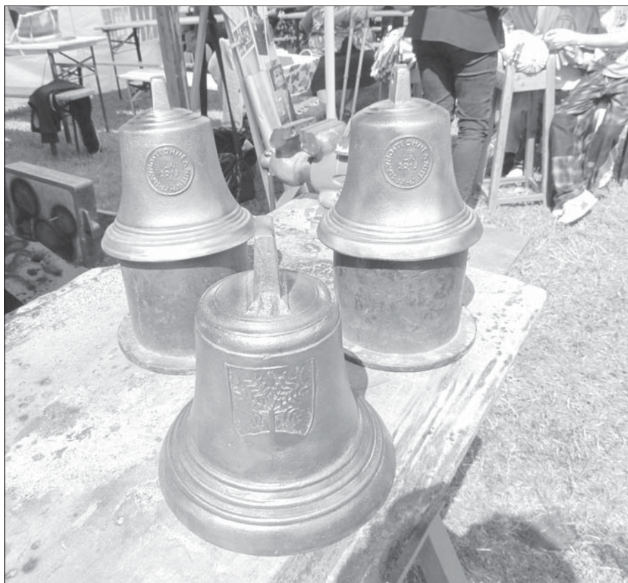
Zvony se znakem Deštného a emblémem slavností.