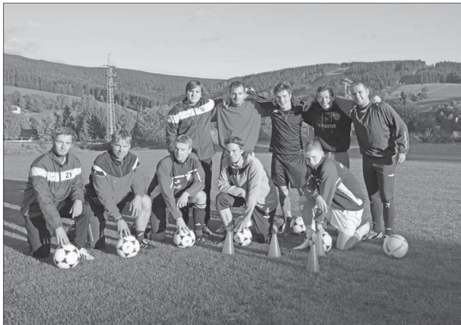
Část fotbalového týmu.

■ Fotbalový tým TJ Sokol Deštné zahájil novou mistrovskou soutěžní sezonu 2013/2014 ve skupině krajské I. B tř. sk. C.