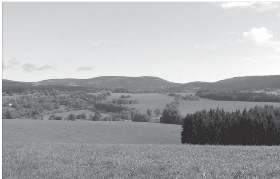
Pohled od Rampuše ke Kunčině Vsi – charakteristický ráz krajiny v Orlických horách.