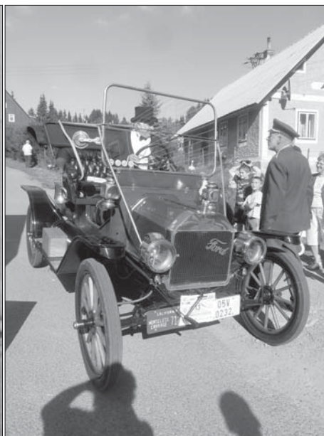
Automobilový veterán projíždí pohádkovou říší.