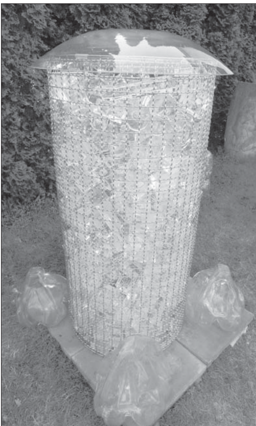
Foukání a tvarování skla.