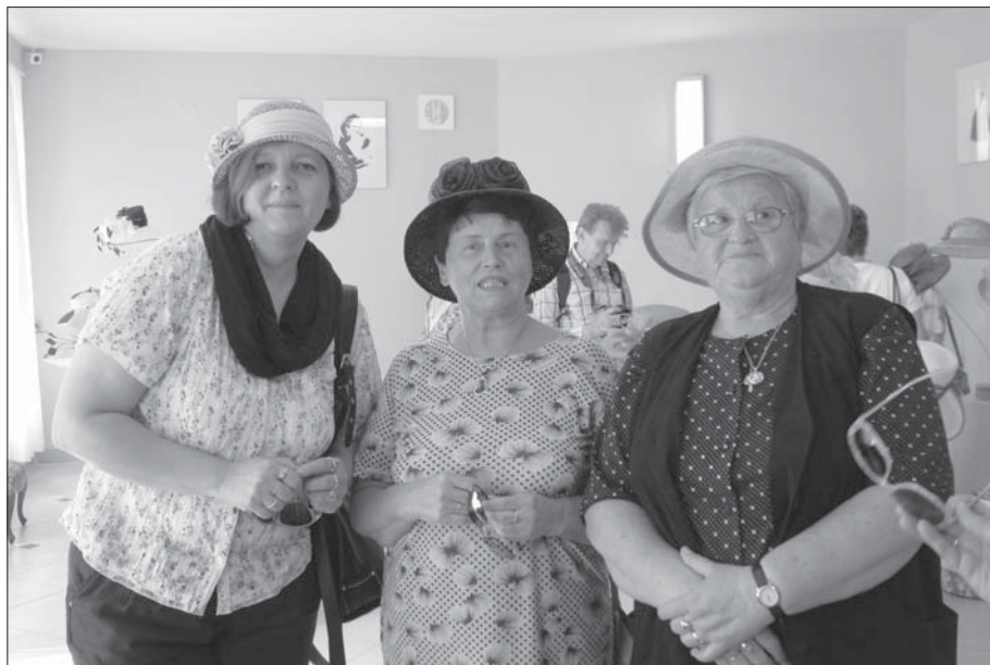
V Galerii klobouků v Nových Hradech.