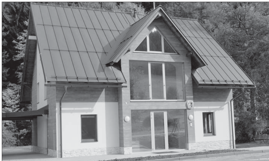
Zdá se, že nová budova horské služby brzy začne sloužit.