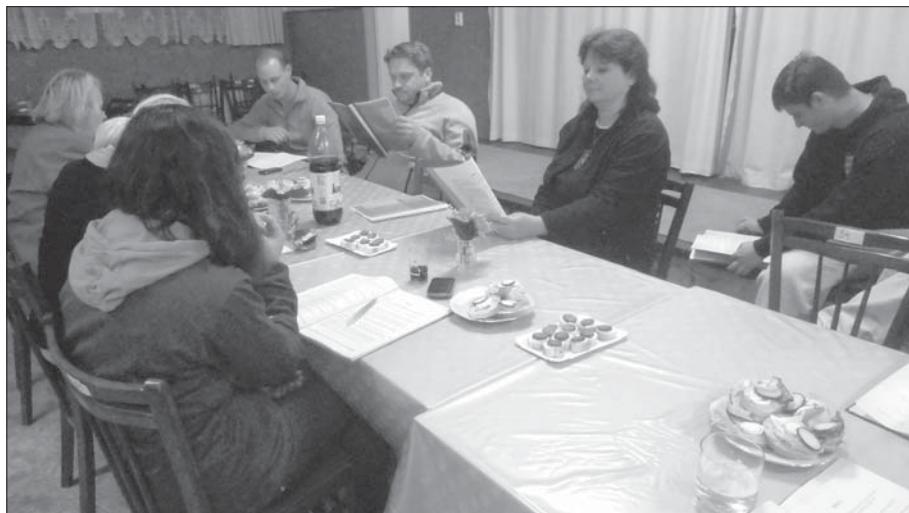
Ze čtené zkoušky.