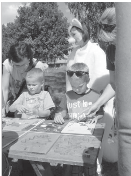
Plnění úkolů u bílé lišky a myslivce.