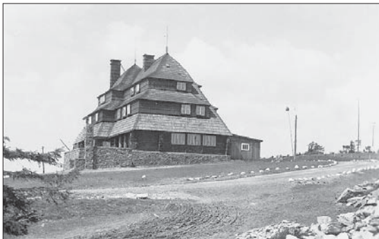
Pohlednice pravděpodobně z období protektorátu, vlastní fotografie však nejspíše pochází z období před rokem 1938, neboť na pohledu je dobře patrné vyretušované místo busty TGM. (Z)