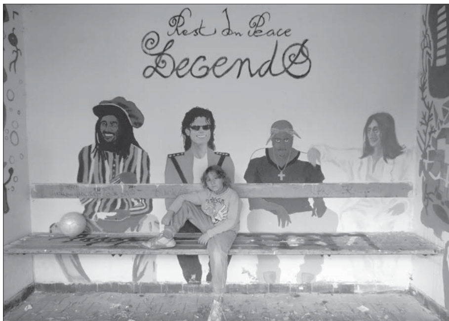
Autobusová čekárna se díky zvěčněným hudebním legendám stává častým terčem fotografů.