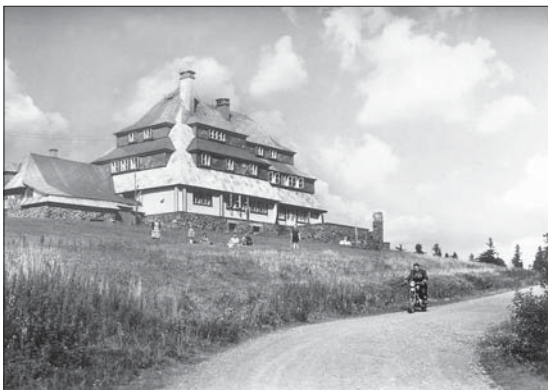
Přelom 60. a 70. let. Vpravo před chatou je dobře patrný prázdný podstavec určený pro bustu Masaryka. (Z)