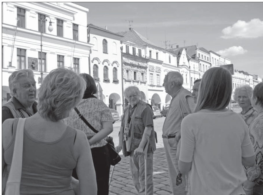
Na náměstí v Litomyšli.

■ Jako každým rokem i letos byl pro seniory uspořádán výlet, který se opět vydařil. Ráno 13. června jsme vyjeli za památkami Pardubického kraje. První zastávkou bylo městečko Proseč, kde jsme navštívili muzeum dýmek a expozici řemesel.