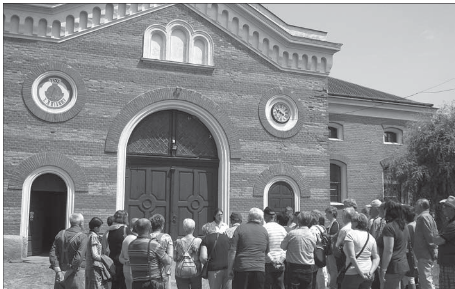
Hřebčín v Heřmanově Městci je součástí Národního hřebčína v Kladrubech nad Labem.