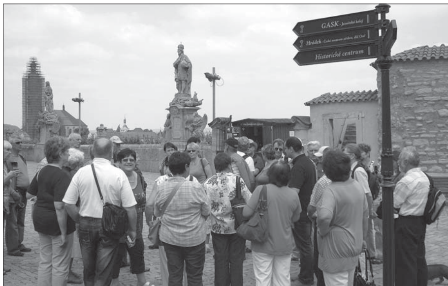
Podobně jako v Praze, byla i v Kutné Hoře vybudována „Královská cesta“. Cesta vede od Chrámu sv. Barbory po terase připomínající Karlův most, až k Vlašskému dvoru, v němž se razily naše nejznámější mince – pražské groše.