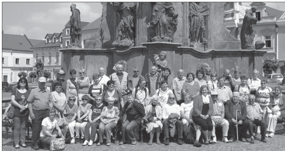
Společné foto v Chrudimi na náměstí.