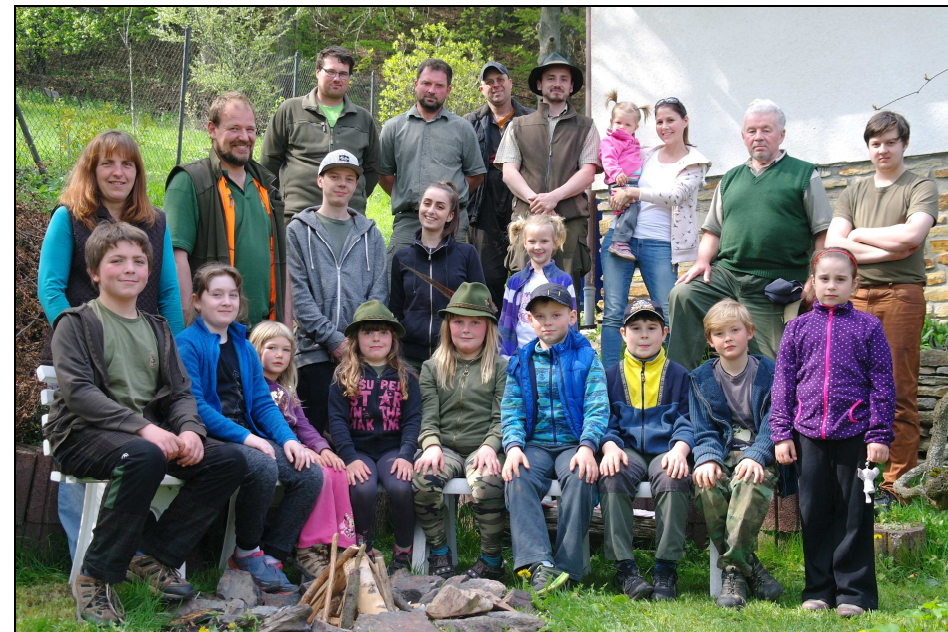
Společné foto - Zlatá srnčí trofej 6.5.2017