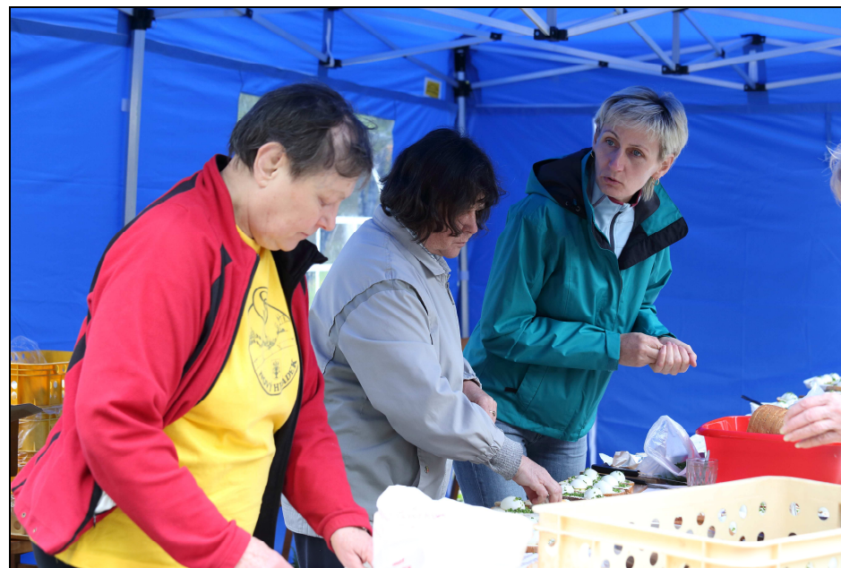
Příprava tradičních chlebů s vajíčkem a šnytlíkem