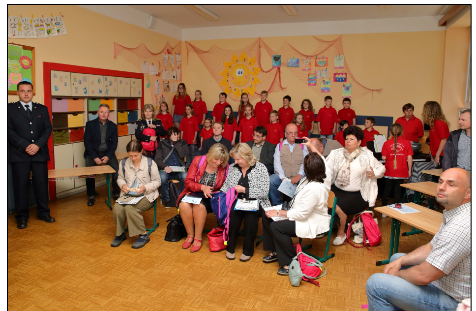
Vystoupení Hrádováčku v rámci soutěže Vesnice roku 25.5.2017