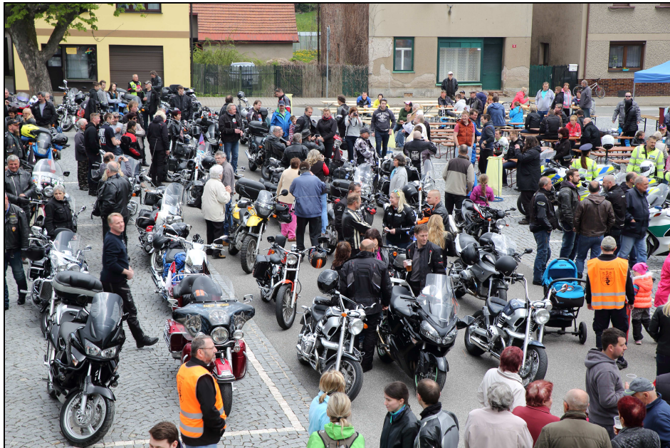
2. Nový Moto Hrádek 6.5.2017