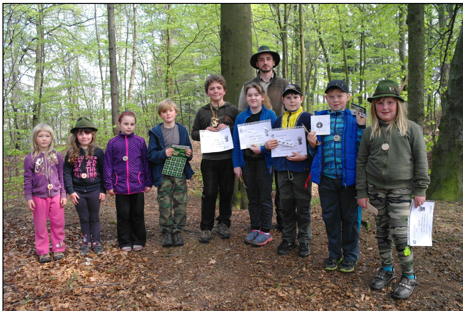
Vítězové a účastníci místního kola soutěže Zlatá srnčí trofej 6.5.2017