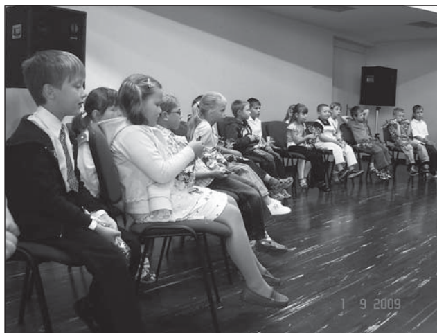
❑ Prvňáčci poprvé ve škole.