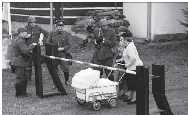
☐ Vojáci i civilisté v dobových oblecích při ukázce přepadení celnice v Kunštátu.