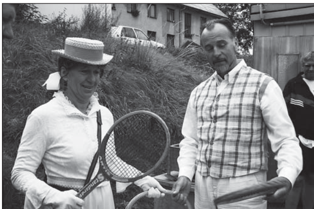
Volba správné rakety je důležitá.

Na plakátu bylo uvedeno, že ceny si rozdělí první, poslední a originální pár. Originalita nebyla nijak specifikována. Chtěli jsme podpořit recesistický přístup, byli jsme zvědaví, co se bude dít ... a ono se dělo.