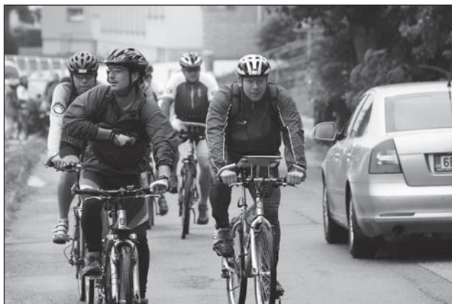
☐ Start Orlického bloudila v kategoriích mužů.