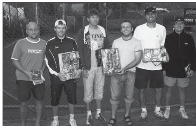
Čtyřhra - vítězové uprostřed.

HORSKÝ KURÝR - Regionální měsíčník pro Rokytnici a okolí.