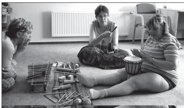
❑ Při muzikoterapii se využívají nejrůznější perkusivní hudební nástroje - na obr. buben djembe či Balaton.

Mimo volnočasové aktivity, jako rekreační pobyty, kulturní a sportovní akce a tematické výlety, nabízí zařízení klientům možnost využívat léčebné terapie: arteterapii, muzikoterapii, snoezelen, hipoterapii, pracovní terapii, fyzioterapii, zahradní terapii - a zájmové kroužky – pracovní dílny, základy na počítači, keramiku, biblické hodiny, košíkářskou dílnu, vzdělávací AZ klub. Do budoucna se připravují další aktivity - canisterapie, kalcovská dílna, sportovní hry. Více informací na: www.uspro.cz