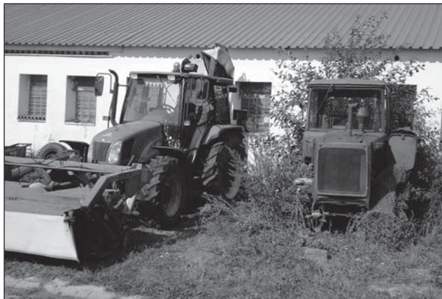
Traktory 20. a 21. století na farmě Orlicko: New Holland a jeho dávný předchůdce DT-78

Zatímco turisté a chalupáři se rozplývají nad jedinečným klimatem a malebnou krajinou, mají Rybeňáci svůj životní osud méně idylický. Blízkost nebe,