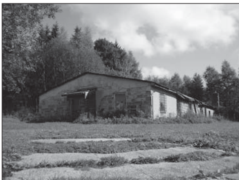
☐ Budova, ve které vznikne provozovna rychlého občerstvení.