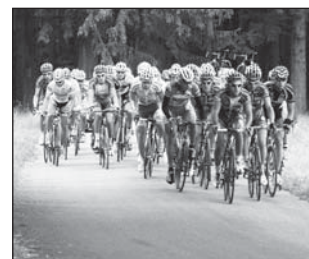
☐ Na celé trati závodu se neustále bojovalo.

Prerádné prostředí Orlických hor bylo dějištěm 7. kola Českého silničního poháru. 144 km dlouhý závod se jel na trati, o které se dalo zjednodušeně říci jen jedno: Nahoru a zase dolů a opět nahoru, o nějaké delší rovince si mohl peloton nechat jen zdát. Na rozdíl od včerejšího