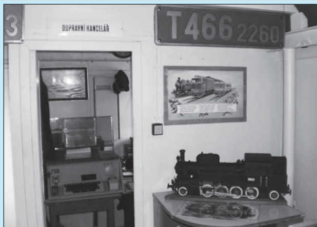
□ Uvnitř vozu bylo možno si prohlédnout řadu modelů i modelových kolejišť včetně dobově vybavené dopravní kanceláře.