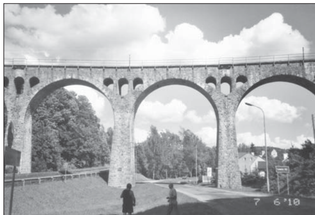
☐ Železniční viadukt v Kladském Lewinu.

Okolo 14. hodiny jsme přešli autobusem do lázní Dušníky. Zde jsme se napili ze dvou léčivých pramenů a navštívili jsme