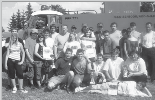
Společná fotografie účastníků Okrskové soutěže v Pěčíně.

Ve středu 23.06.2010 ve 12:01 hod. byla jednotka povolána operačním střediskem HZS ČR k transportu osoby, která v podzemí pevnosti Hanička omdlela. Po příjezdu jednotky byla postižená osoba již ve správné budově pevnosti. Hasiči spolu s Horskou službou Říčky provedli předlékařské ošetření a po příjezdu ZZS RK předali pacientku lékařce. Dále pomohli s naložením ženy do sanitky. Na místě součinnost s Horskou službou ČR - Říčky v Orl.h., ZZS RK, HZS RK a PČR.