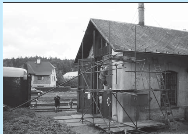
□ Dobrovolníci z Letohradského klubu železničářů každý víkend pokračují v opravách objektu bývalé výtopny.