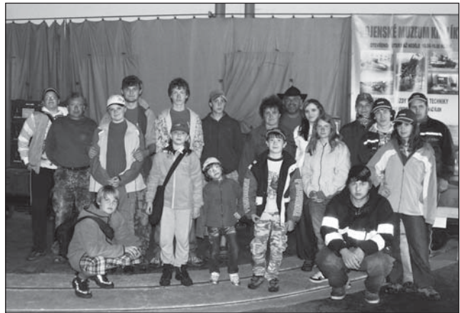
❑ Mladí rokytničtí hasiči strávili víkend na dělostřelecké tvrzi Hůrka u Králík.

ať jede. Samozřejmě že jsem nejel. Ale nebyl jsem jediný. Alespoň jsem se pěkně prospal místo zkaženého rána. Poté, co se z lesa vrátili pracanti, dostali jsme nový „požár“ a s ním i nový úkol. Měli jsme najít lístečky, které byly schovány za naší budovou. Naše skupina našla vše a přesunula se do pokoje, kde začala řešit, kdo a jak by mohl způsobit požáry, které nám dávali vedoucí. Po večeři nám ještě vedoucí dali papír s morseovkou, který jsme museli vyluštit. Začalo se stmívat. Večeře. Vynikající gulášek. Jelikož jsme měli skoro všechny