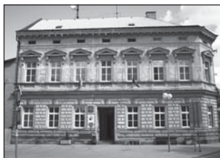
možné do nich nahlédnout na městském úřadě.

V tomto čísle přinášíme komentovaná usnesení Rady města z jednání ve dnech 12. července a 23. srpna a ze Zastupitelstva města, které se konalo dne 12. července. Úplná znění všech přijatých usnesení jsou k dispozici na internetových stránkách města www.rokytnice.cz nebo je