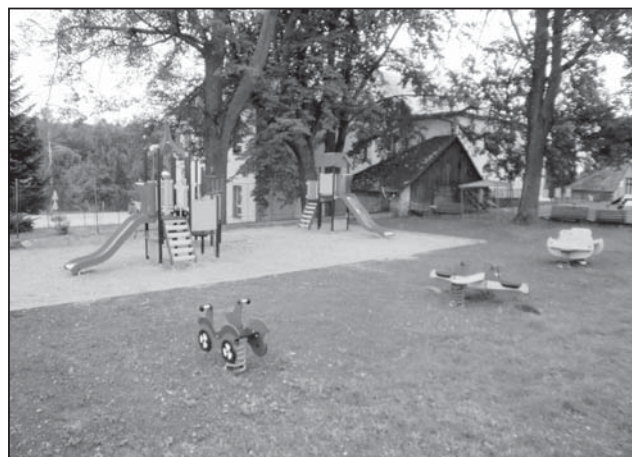
□ Dětské hřiště pro nejmenší v prostoru zahrady Mateřské školy v Rokytnici v Orlických horách.

„Po zhruba 14 dnech se dá již trochu bilancovat – jaká je návštěvnost jednotlivých prvků a jaké jsou vaše postřehy?“