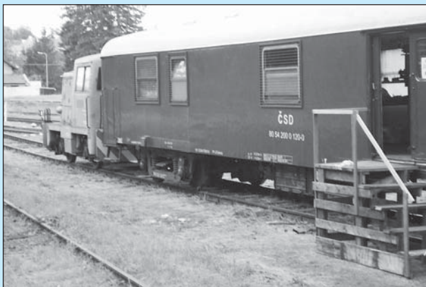
□ Rokytnické železniční muzeum rozšířilo po dobu prázdnin nabídku pro návštěvníky o expozici umístěnou v železničním vagónu bývalých Československých státních drah.

V rokytnickém železničním muzeu se o prázdninách stále něco dělo. Nabídka pro návštěvníky byla rozšířena o expozici ve vagónu bývalých Československých státních drah. K vidění tu byla modelová kolejiště, dopravní kancelář či různá zařízení sloužící dřívě k obsluze vlaku. Před výtopnou byl nově instalován před-