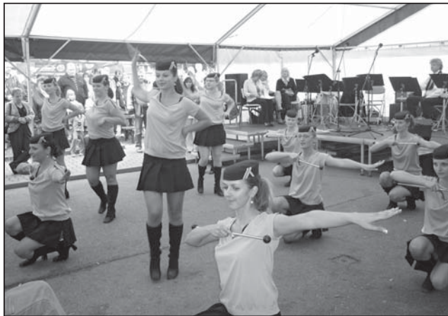
☐ Nedělní vystoupení mažorettek v párty stanu na náměstí.