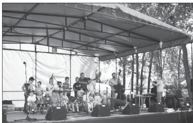
□ Vystoupení dětí z mateřské a základní školy v Orlickém Záhoří.