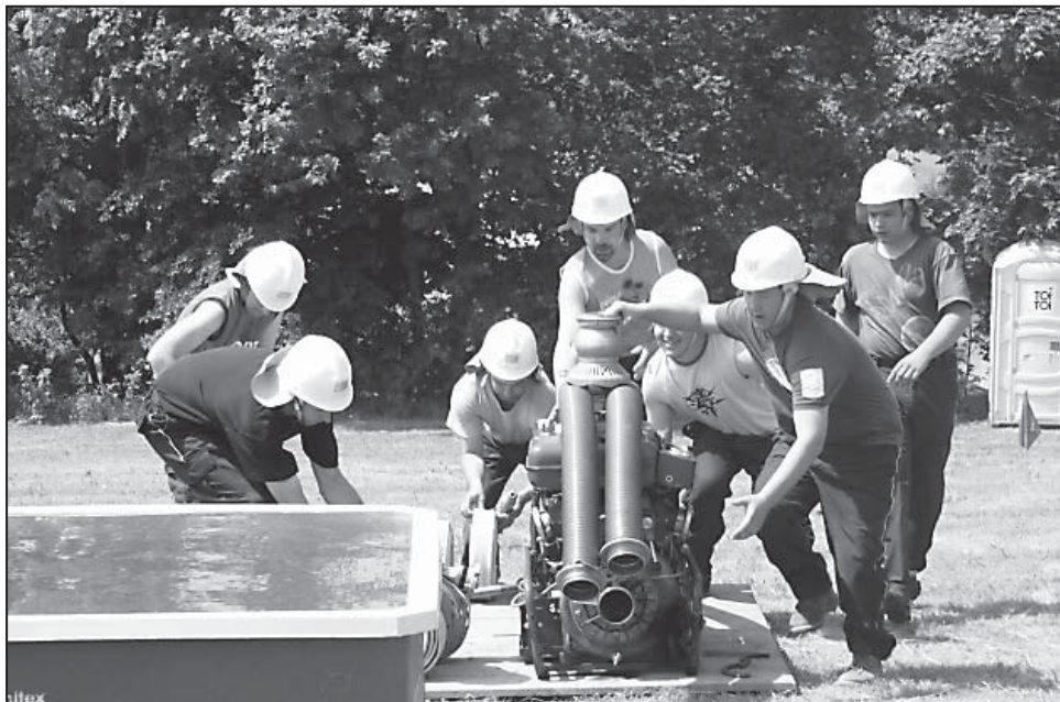
□ Díky rychlému startu a dobrému počínání na základě získalo družstvo Pěčín B druhé místo.