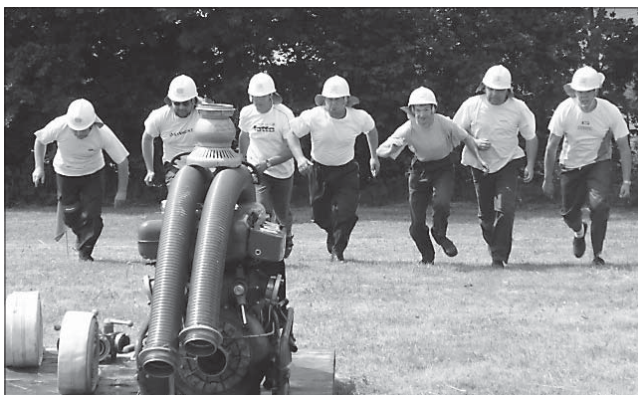
□ Družstvo Pěčín A na startu.

lo začít soutěžit. Zápolení bylo opravdu napínavé. Hned první startující družstvo pěčínských hasičů nasadilo vysokou laťku. Dobře si vedlo i ženské druž-