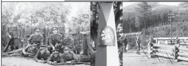
18. září ve 14 hodin v Orlickém Záhoří

V noci na 19. září 1938 byla na celnici v Kunštátu čtyřčlenná stráž. Zatímco dva členové drželi hotovost uvnitř budovy, zbylí dva hlídali u přechodu. O půl druhé zpozorovali stíny směrem od řeky a krátce po té byl po nich vržen ruční granát. Hlídka též začala po patnácti útočnicích střel a po té co použila granátu, ti ustoupili zpět.