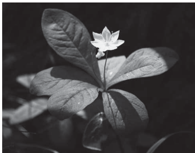
□ Fotografie z procházky za květy Orlických hor