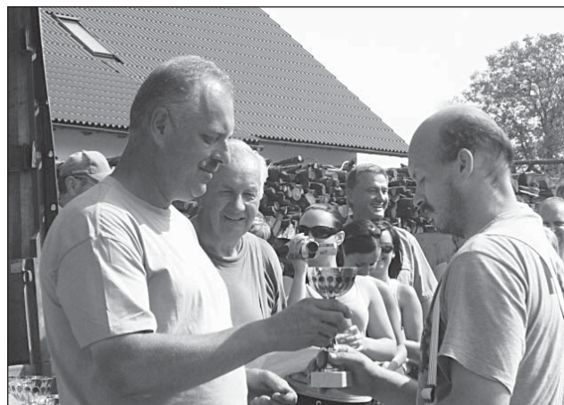
□ Slavnostní vyhlášení výsledků a předávání pohárů.

Orlické Záhoří I, 5. Pěčín A, 6. Orlické Záhoří II, 7. Rokytnice I, 8. Wilkanów. Text a foto ZS