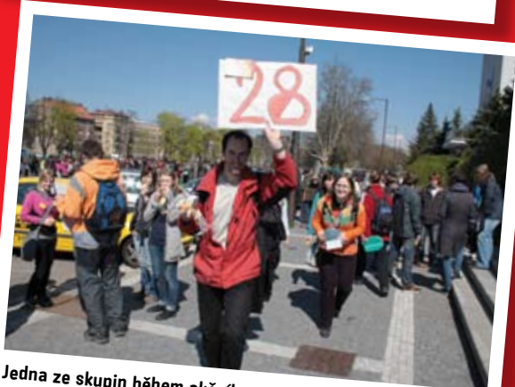
Jedna ze skupin během akčního odpoledne