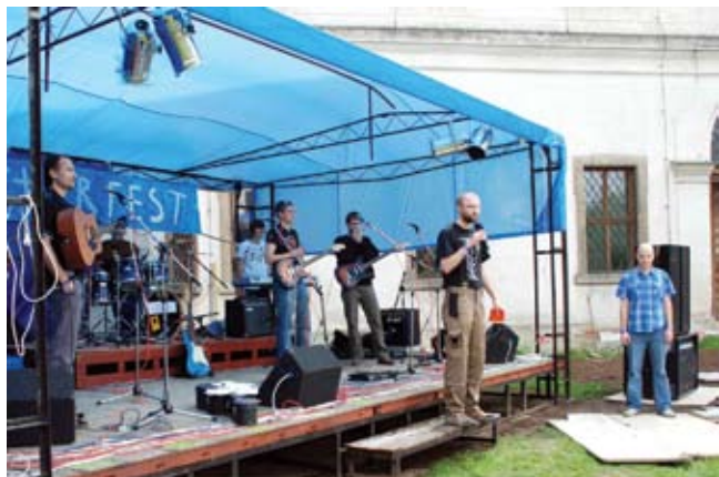
Jedno z vystoupení na minulém ročníku Klášterfestu, autor: Cyril Malík

(lb) – Je potěšitelnou zprávou, že počet přehlídek současné křesťanské hudby v naší zemi neustále roste. Jednou z akcí, která si již našla trvalé místo v kalendáři hudebních fajnšmekrů, je kutnohorský Klášterfest. Jeho čtvrtý ročník proběhne v sobotu 7. května na zahradě voršilského kláštera v Kutné Hoře. „Nápad uspořádat festival vznikl v hlavách několika kutnohorských muzikantů-nadšenců zkraje roku 2008. Hnacím motorem vzniku Klášterfestu byla touha zahrát si společně a mezi svými. První Klášterfest vznikl doslova „na koleně“, ale ukázalo se, že má smysl ho uspořádat za rok znovu. Zatím to tak vypadá pořád, takže pokračujeme a jsme moc vděční, že se