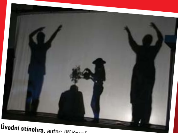
Úvodní stínohra, autor: Jiří Knopf