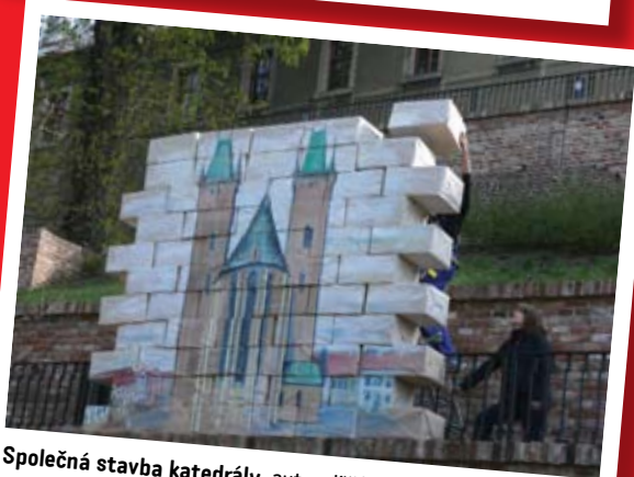
Společná stavba katedrály, autor: Jiří Knopf