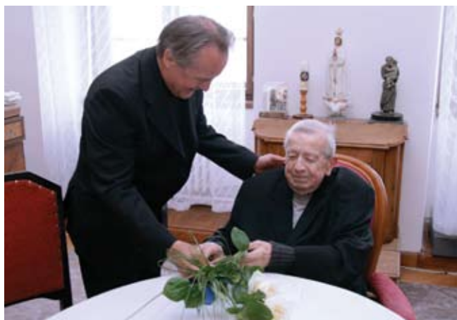
Blahopřání od Mons. Jana Vokála, autor: Luděk Bárta

(Ib) – Ve středu 13. dubna oslavil své 91. narozeniny emeritní biskup královéhradecký a osobní arcibiskup Mons. Karel Otčenášek. Již ráno přijal delegaci gratulantů ze svého rodného města, Českého Meziříčí. Dopoledne se krátce setkal se zaměstnanci biskupství. „Dělejte dobro, dokud jste mladí, ve stáří to již tolik nejde,“ vzkázal oslavenec po symbolickém přípitku shromážděným. Patrně největší radost mu udělalo odpolední setkání s Mons. Janem Vokálem. Ten do Hradce Králové přijel poprvé od svého jmenování zdejším sídelním biskupem na krátkou soukromě-pracovní návštěvu.