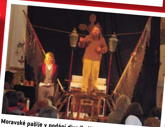
Moravské pašije v podání divadla Víti Marčíka, autor: P. Karel Moravec