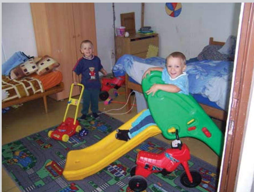
Děti při hře v jednom z bytů sociální rehabilitace v Havlíčkově Brodě.

Ptal se Luděk Bárta Rozhovor připravila Vladka Dobešová