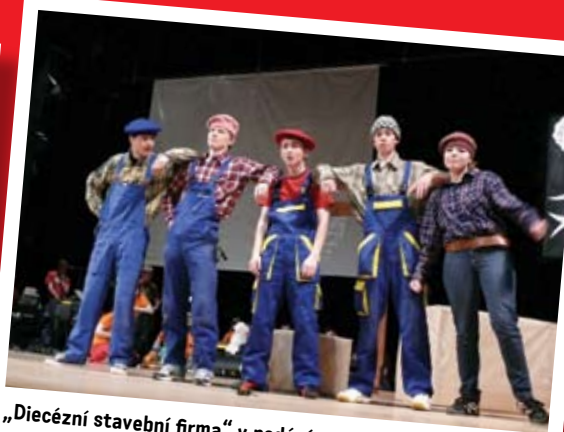
„Diecézní stavební firma“ v podání režie, autor: Jiří Knopf