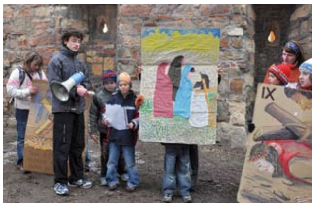
Děti s vlastnoručně namalovanými zastaveními křížové cesty, autor: Jiří Rejlek

Součástí setkání je křížová cesta, kde si obrazy jednotlivých zastavení za pomoci nejrůznějších výtvarných technik připravují jičínské rodiny nebo skupinky dětí chodících na náboženství či do skautských oddílů. Na půdě jičínské fary už je několik sérií takových obrazů z minulých let. Modlitbou křížové cesty u těchto zastavení děti své setkání zakončily.