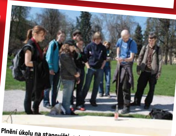
Plnění úkolu na stanovišti