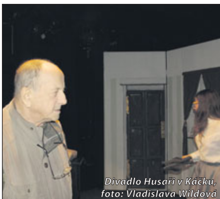
Divadlo Husaři v Káčku