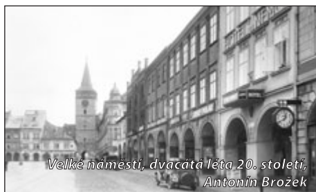
Velké náměstí, dvacátá léta 20. století, Antonín Brožek

Dům čp. 2 vedle zámku patřil na počátku 17. století Jeronýmu Bukovskému z Neudorfu, regentu panství Smiřických. Podobnou roli zastával i za Albrechta z Valdštejna. Vedlejší dům čp. 3 má bohatou historii spjatou s prusko-rakouskou válkou v roce 1866. Dne 2. 7. 1866 se zde ubytoval pruský král Vilém I. U jeho lože byly dokončeny poslední detaily rozhodující bitvy prusko-rakouské války u Sadové, která se odehrála o den později. Po roce 1908 se majitelem čp. 3 stal Otto Goliath, obchodník v suknech. Sousední čp. 4 nese domovní znamení hvězdy, podle které byl pojmenován i hostinec, který zde byl od poloviny 18. století.