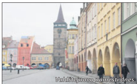
Valdštejnovo náměstí dnes

Dům čp. 2 vedle zámku patřil na počátku 17. století Jeronýmu Bukovskému z Neudorfu, regentu panství Smiřických. Podobnou roli zastával i za Albrechta z Valdštejna. Vedlejší dům čp. 3 má bohatou historii spjatou s prusko-rakouskou válkou v roce 1866. Dne 2. 7. 1866 se zde ubytoval pruský král Vilém I. U jeho lože byly dokončeny poslední detaily rozhodující bitvy prusko-rakouské války u Sadové, která se odehrála o den později. Po roce 1908 se majitelem čp. 3 stal Otto Goliath, obchodník v suknech. Sousední čp. 4 nese domovní znamení hvězdy, podle které byl pojmenován i hostinec, který zde byl od poloviny 18. století.