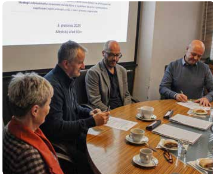
Memorandum o odpovědném stravování v SSMJ bylo podepsáno dne 3. prosince 2025