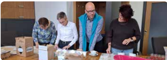
Testování vzorků, které dodali výrobci v rámci výběrového řízení

Od 1. ledna 2026 vstupuje v účinnost nová vyhláška Ministerstva zdravotnictví č. 160/2024 Sb., která ukládá všem školským zařízením povinnost zajistit bezplatnou dostupnost menstruačních pomůcek pro dívky starší devíti let. Město Jičín se na tuto změnu připravilo s předstihem a díky zodpovědnému přístupu má vše