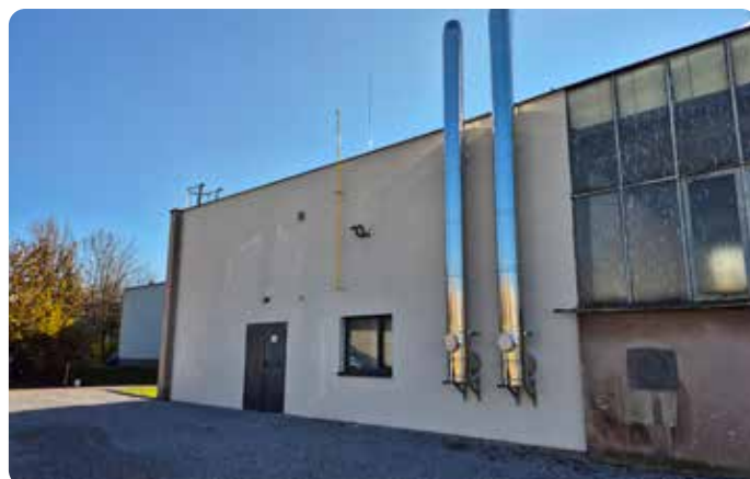
V roce 2025 proběhla rekonstrukce další kotelny, tentokrát v areálu ZŠ Železnická. Hlavním účelem této kotelny je vytápění základní školy a Lepařova gymnázia.