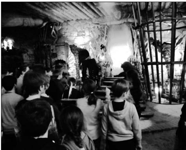
Učitelé a žáci školy