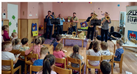
Vystoupení dechového oddělení ZUŠ Chlumec n. C.

V úterý 13. května byla hudba slyšet i přes stěnu školky. Zavítalo k nám dechové oddělení ze Základní umělecké školy v Chlumci nad Cidlinou. Poslechli jsme si vystoupení složené ze známých melodií – například zazněla znělka z Pirátů z Karibiku. Dechové nástroje si děti mohly i vyzkoušet. Věřím, že vystoupení bylo pro děti motivací a že třeba budeme mít v budoucnu nové hudební talenty.