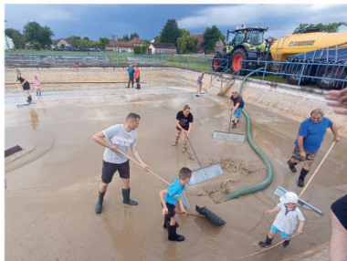
Čištění koupaliště 31. 5. 2025

Už je tomu tak. Náš sbor v letošním roce slaví 140 let od svého založení. Po dlouhých přípravách jste to s námi mohli přijít v sobotu 14. června na místní návěs oslavit. Při této příležitosti zde byla k vidění spousta techniky integrovaného záchranného systému, RC modeláři nejen s hasičskou technikou, požární útok s koňskou stříkačkou, soutěž v požárním sportu, dětské atrakce, projížďky s koňským spřežením a večerní rockový mini festáček v podání kapel Polymetal, Natříje a Řemen. Moc děkujeme, že jste se s námi přišli pobavit v tak hojném počtu. Podle odhadů se Vás během dne a večer na zábavě vystřídalo okolo 400. Moc děkujeme za podporu !!!