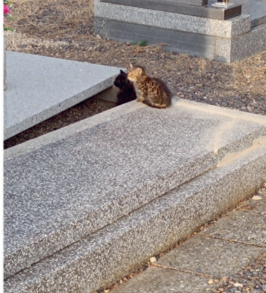
Zásah Lovčice - záchrana zvířat 27. 6. 2025