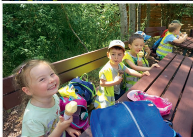
4x foto: Výlet do Fajnparku

Po cestě zpátky už nás po celém dnu bolely nožičky, ale zvládli jsme to a na nádraží už na nás čekal vlak do Lovčic. Počasí nám přálo, sluníčko celý den hezky hrálo a děti zažily den plný zábavy, pohybu a mnoha zážitků.