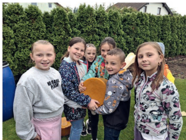
↓ Návštěva ZOO