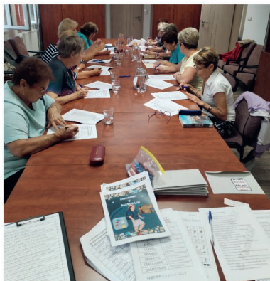
Posilovna v červenci

V červenci nás čeká zlaťoučké kouzlo! Už se nemůžeme dočkat finální proměny v obrazy plné fantazie a kouzla steampunku. Sledujte nás!