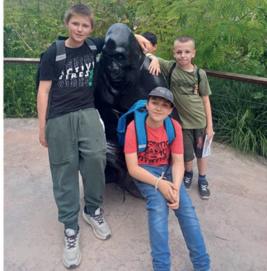
2x foto: Návštěva ZOO