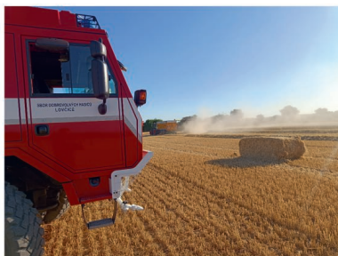
Požární asistence Lovčice 2. 7. 2025