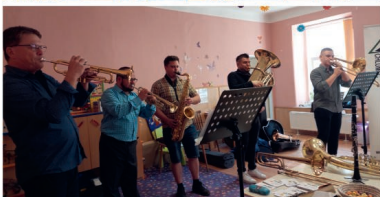
2x foto: Výchovný koncert

Zajímavý program připravili i zástupci polytechnického centra. Děti si vyzkoušely práci s moderními technologiemi – programovaly roboty, jezdily s Intelino Smart Train, pracovalo se s 3D pery, Sphero mini nebo brýlemi virtuální reality. Během aktivit se žáci učili nejen základy programování, ale také spolupráci, komunikaci a trpělivosti.