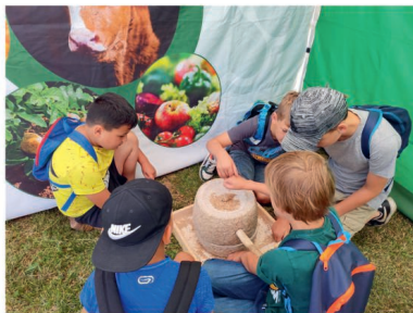
Návštěva Lovčické zemědělské a. s.