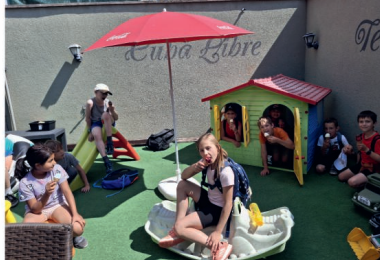
Zmrzlina v Chlumci