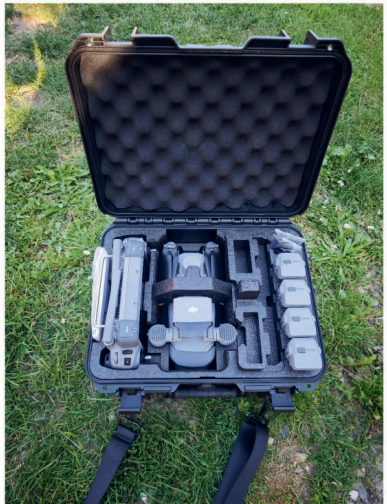
2x foto: Předání dronu