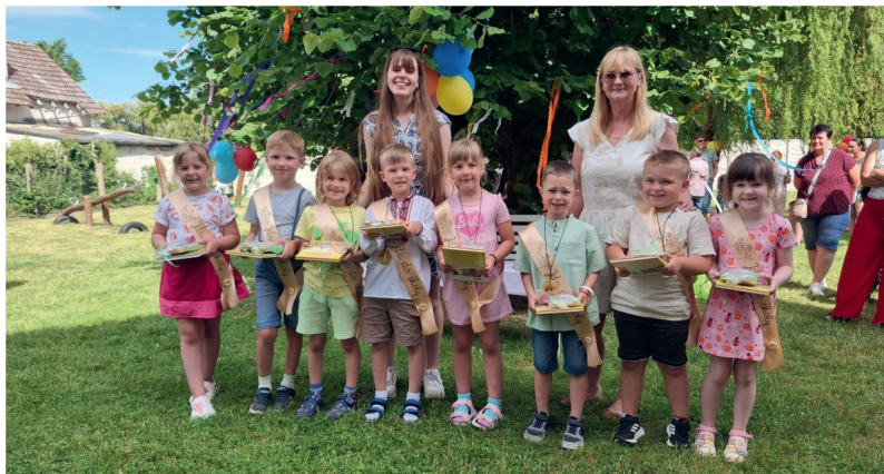
↑ 4x foto: Barevný týden