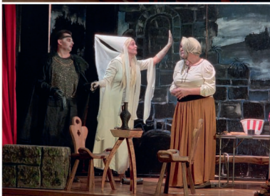
2x foto: Komu straší ve věži 18. 5. 2025