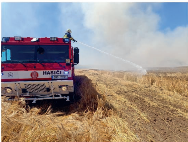
Zásah Chlumec n. C. - požár pole 2. 7. 2025