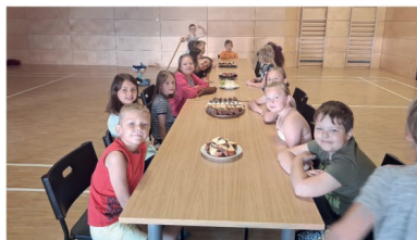
Přesnávačka v KTZ