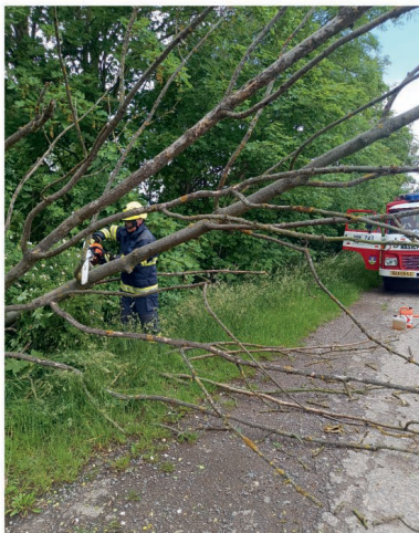
Zásah Lovčice - strom přes cestu 5. 6. 2025