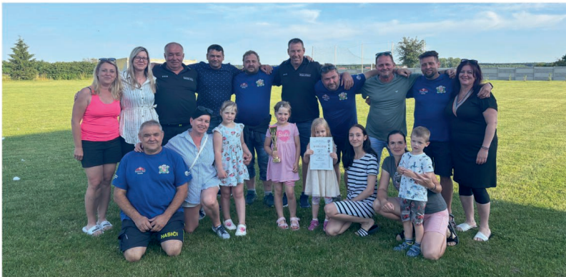
Soutěž Běrunice 21. 6. 2025