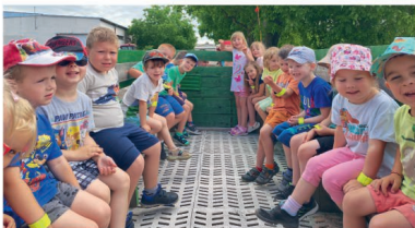
2x foto: Návštěva Lovčické zemědělské a. s.

Ted se ale přesuneme z kravína rovnou ke zvířátkům do podmořského světa. Školka je v provozu i během prvních dvou týdnů prázdnin. I přes to už ale jedeme na prázdninové vlně – v teplých letních dnech nás baví vodní hrátky na zahradě, smějeme se a užíváme si poslední dny spolu.