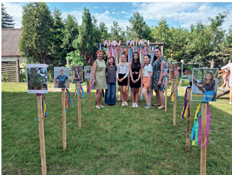
3x foto: Zahradní slavnost