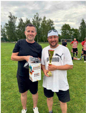
4. místo Újezd