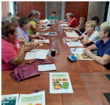
3x foto: Posilovna mozku

Začátkem srpna jsme se věnovali tématu zavařování, nakládání a výrobě džemů. Povíдали jsme si o ovoci i zelenině, sdíleli recepty a vyzkoušeli si paměťové hry – od doplňování písmen, přes přesmyčky až po originální hru s víčky od sklenic. Nejvíce zábavy přinesla hra „10 sekund – vyjmenuj 3“. Děkuji všem za příjemnou atmosféru a energii, se kterou se zapojili. V září se vydáme na houby – ať už v lese, nebo při tréninku paměti.