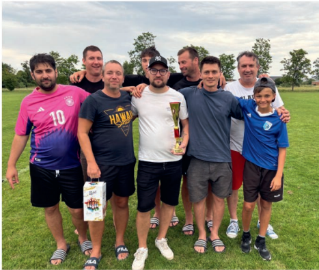
3. místo Lužec