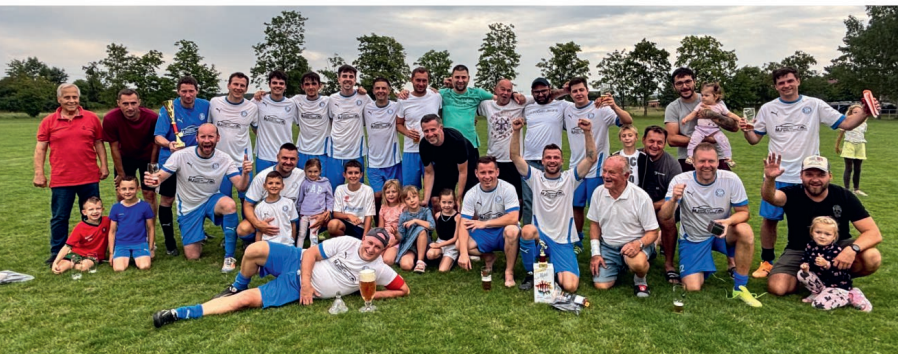
Vítězný tým Sokol Lovčice