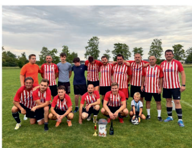
2. místo Převýšov