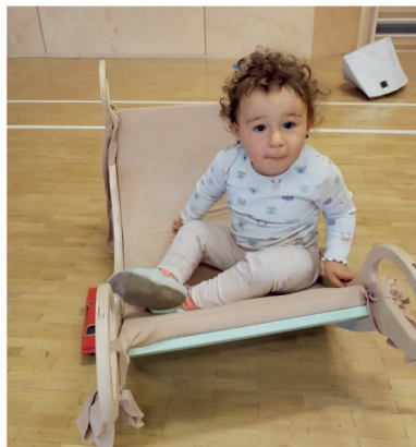
3x foto: Knihovniček

Volné místo máme v Knihovničku – setkávání maminek s dětmi od 0 do 3 let, které probíhá každé pondělí od 9:00 do 10:30 hodin v KTZ. Přihlásit se můžete na tel. 728 229 229 nebo na e-mailu knihovna.lovcice@seznam.cz .