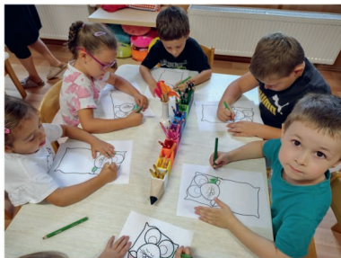
Ukládání myšek ke spánku