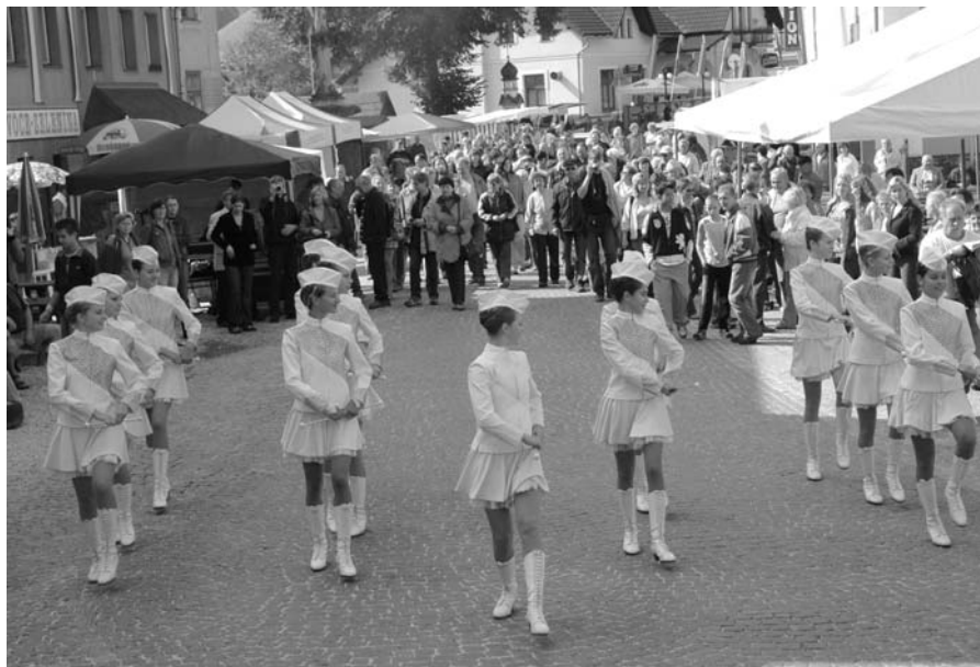
↑ Průvod mažoretek potěšil nejedno oko

Děkujeme všem, kteří se na přípravě a organizačním zajištění pouti podíleli, a přejme si, aby si naše pouť i nadále udržela svou úroveň a jedinečnost.