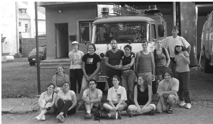
↑ Mezinárodní návštěva u našich hasičů

Dobrovolníci odvedli velký kus práce při rekonstrukci staré barokní fary, ale vykonali i některé prospěšné práce pro obec. Pomohli s přípravou koncertu „Krkonošova zahrádka“ a s úklidem areálu starého hřbitovního