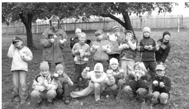
Žáci 2.třídy ZŠ sbírají na farské zahradě jablka pro mlsné kozy.

Přinášíme vám několik snímků z výukových programů, které připravilo středisko SEVER pro žáky Základní školy a Mateřské školy v Horním Maršově: