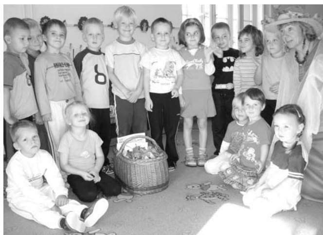
Program pro mateřskou školu s Podzimní vílou a ježkem Bodlinkou z cyklu Čtvero ročních období