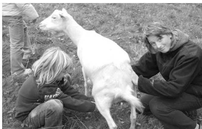
Program o domácích zvířatech pro 2.třídu.