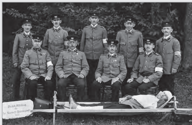
V r.1927 měli hasiči i družstvo zdravotníků.