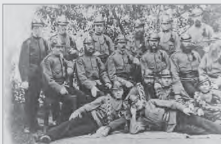
Pravděpodobně nejstarší snímek maršovských hasičů, bohužel se nepodařilo přesně určit rok vzniku.

Možná vás napadne – a kdo hasil předtím, než byl sbor založen? Nejspíš každý, kdo byl právě po ruce, ten popadl kbelík, ten žebřík ... Postupem doby se však ukázalo, že zejména pro boj s velkými požáry je potřeba mít organizovanou skupinu hasičů, řádně vycvičenou, proškolenou a vybavenou. Stát se členem hasičského sboru byla pro každého čest. A tak už 140 let pomáhají maršovští dobrovolní