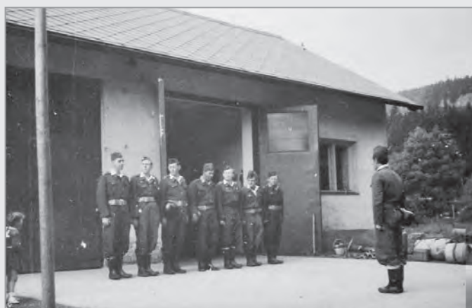
Předchůdkyně dnešní hasičárny byla svépomocně postavena v r. 1956.