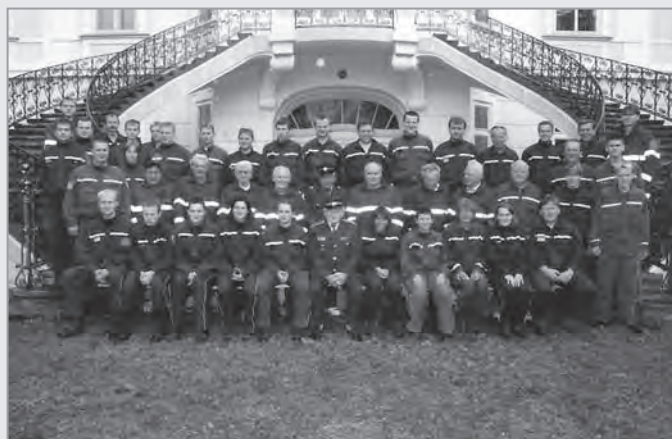
Společná fotografie celého sboru po dlouhých 68 letech!