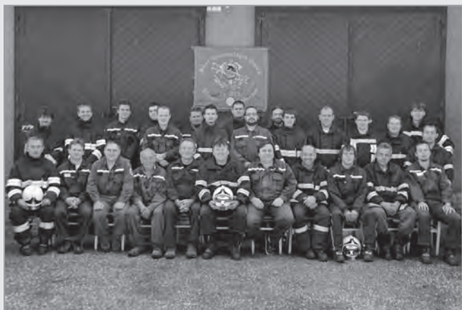
Poslední společná fotografie sboru z r.2012.

Odpověď z krajského úřadu není vůbec příznivá a je velkým zklamáním. Krajský úřad nám neuvolní (pokud se situace nezmění) žádný příspěvek na techniku jednotky, která je zařazena do plošného pokrytí kraje a zasahuje na území kraje! Nutno podotknout, že náš kraj je asi jediný v republice, který nepřispívá na pořízení nové zásahové techniky. Tedy nepodporuje přidělení dotace ze státního rozpočtu na své území a vlastně nabízenou spoluúčást státu z důvodu nepokrytí zbývající části nákladů odmítá. I když v posledním a tudíž snadno srovnatelném případě přidělení státní dotace na pořízení nové cisterny do našeho kraje byl uvolněn z prostředků Královéhradeckého kraje příspěvek ve výši 2 mil. Kč. A to městu, které má nesrovnatelné finanční možnosti v porovnání s malou obcí. To jasně vypovídá o nesystémovém prostředí, ve kterém žijeme. Přitom se jedná právě v tomto nesystémovém prostředí o jediný systémový krok. Nákup nové techniky totiž vyřeší stávající