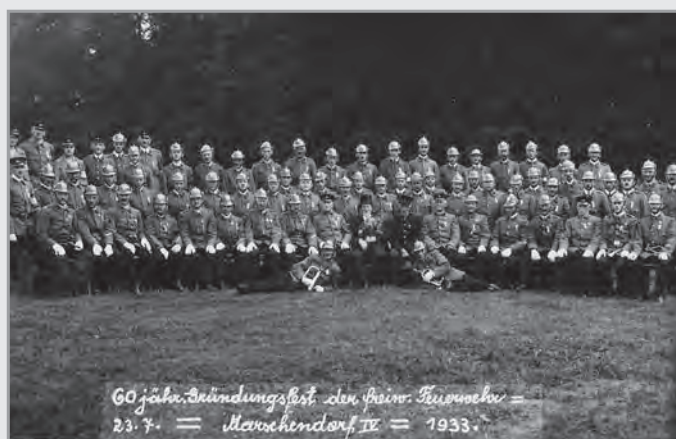
V řadách hasičů jsou i dvě ženy, snad zdravotnice, najdete je? Toto je na dlouhou řadu let poslední společná fotografie všech maršovských hasičů – další společná byla pořizena až v r.2001.