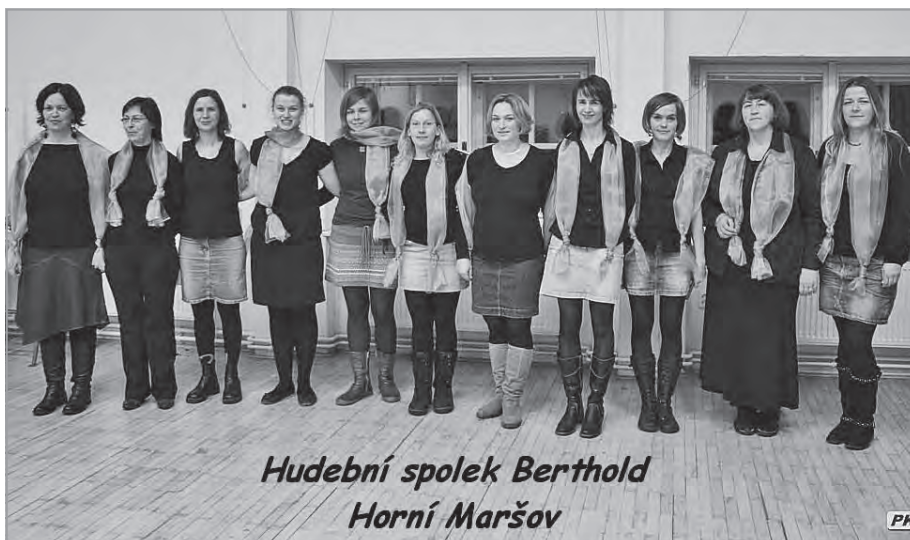
Hudební spolek Berthold Horní Maršov

Náš amatérský pěvecký spolek, který vznikl na podzim minulého roku, se poprvé představil maršovské veřejnosti na Vánočním pobejtku s tradičními českými koledami. Velmi nás povzbudila přízeň publika (kterému tímto velmi děkujeme), a tak jsme neváhaly a hned v únoru jsme několika veselými lidovými písněmi oživily masopustní rej na náměstí.