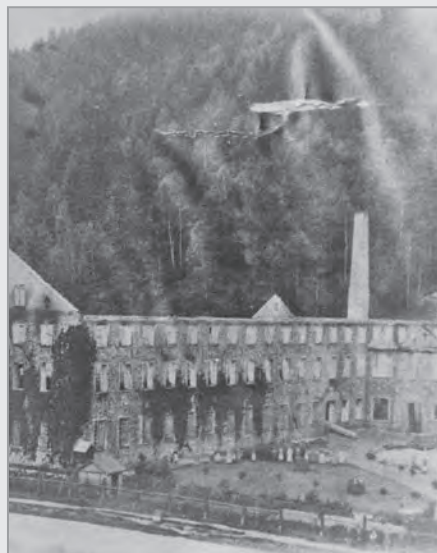
Jeden z největších požárů v historii obce – přádelna lnu v Temném Dole r.1887.

Samozřejmě, že od dob založení sboru se mnohé změnilo. Co se však určitě nezměnilo, je pocit zodpovědnosti a ochota pomáhat všem, kteří to potřebují.