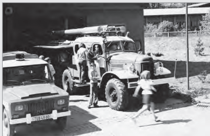
Technika 80. let – sovětský nákladák s cisternou a rumunský terenní vůz.