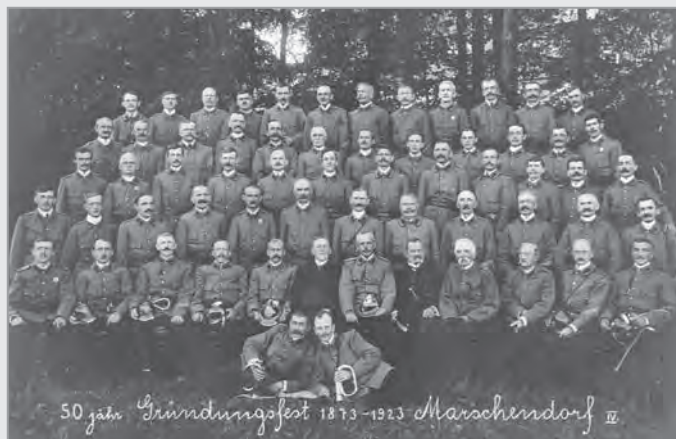
Důstojná fotografie u příležitosti padesátého výročí založení sboru.