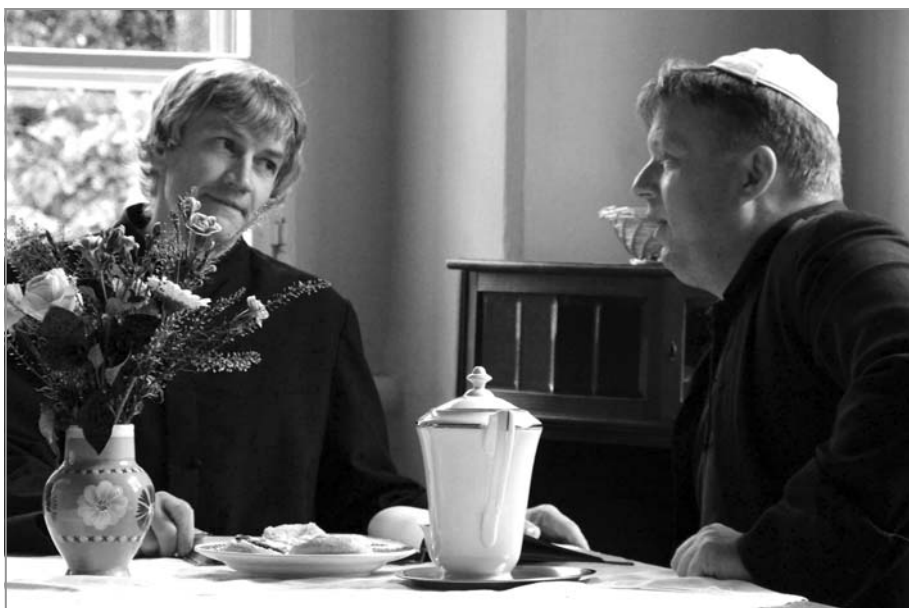
OTEVŘENÁ FARA: Biskup na návštěvě u pana faráře na faře