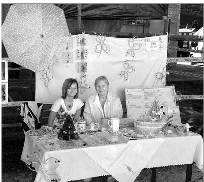
MARŠOVSKÁ POUŤ: Stánek s výrobky Stacionáře RIAPS Trutnov