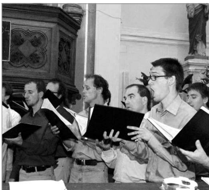
BOHEMIACHOR: Hlasy sboru zaplnily celý kostel