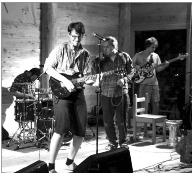
FESTIVAL DOTEKY: Kapela Svěží zelenina – opravdu svěží překvapení!