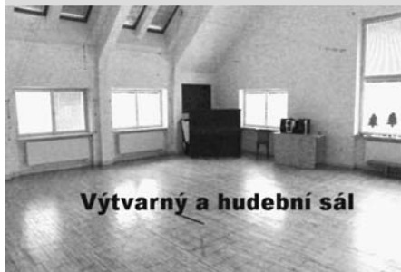
Výtvarný a hudební sál