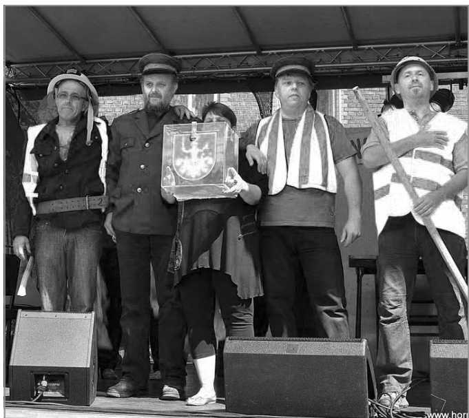
MARŠOVSKÁ POUŤ: Vystoupení maršovských ochotníků bylo zakončeno sbírkou na nové hasičské auto