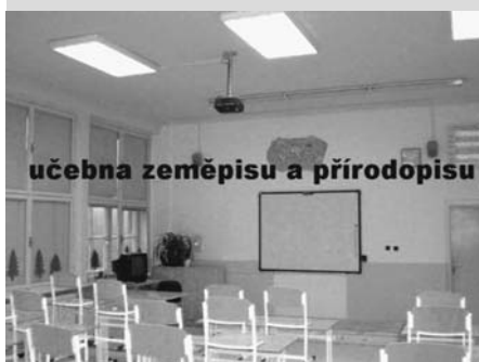
učebna zeměpisu a přírodopisu