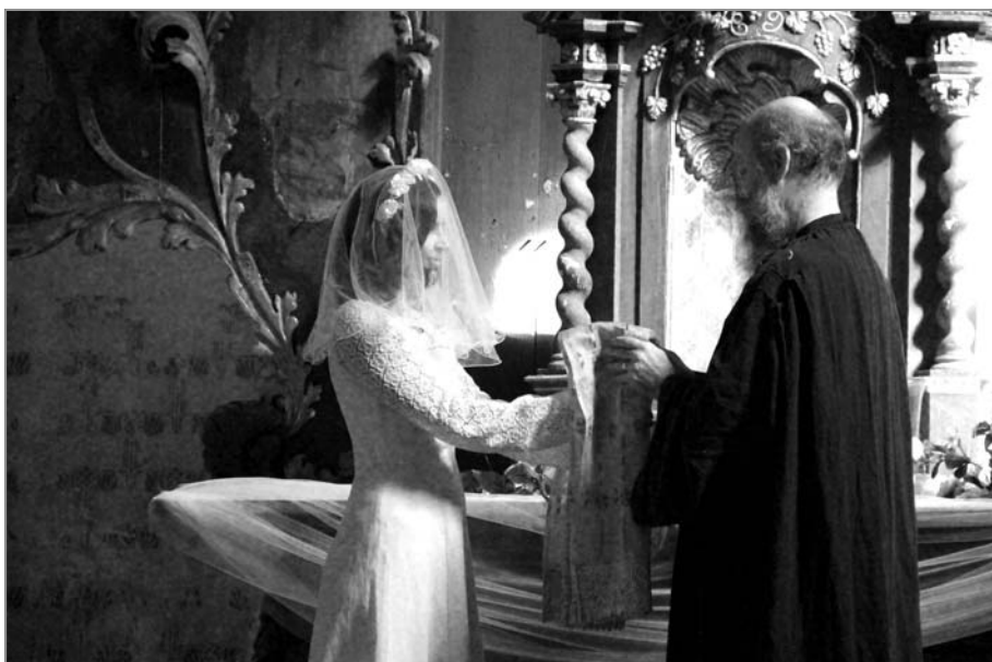
OTEVŘENÁ FARA: Vystoupení v kostele