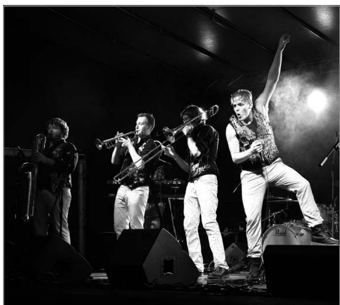
MARŠOVSKÁ POUŤ: Kapela Tleskač v plném nasazení