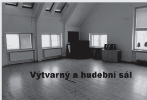
Výtvarný a hudební sál

Učebna s interaktivní tabulí 150 Kč/hod. 600 Kč/den