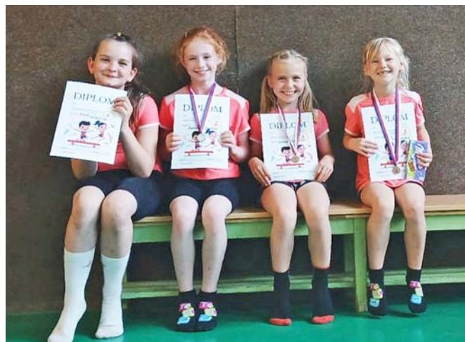
Zasloužené medaile za skvělé výkony.

Závody probíhaly ve velmi napjaté atmosféře. Naše závodnice soutěžily v kategoriích dle věku a výkonnosti a i přes velkou konkurenci dokázaly obstát.