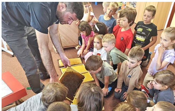
Děti si prohlédly i plástve s živými včelami.

V úterý 10. června jsme společně vyrazili na výlet do ekologického centra A Rocha. Tam nás čekal pohled do krásné přírodní zahrady a účast na ekologickém výukovém programu. V rámci praktických ukázek jsme mohli na vlastní oči vidět různé obojživelníky – žáby, čolky, mloky i užovku. Děti se tak zábavnou formou dozvěděly mnoho zajímavostí o ochraně přírody a živé fauně.