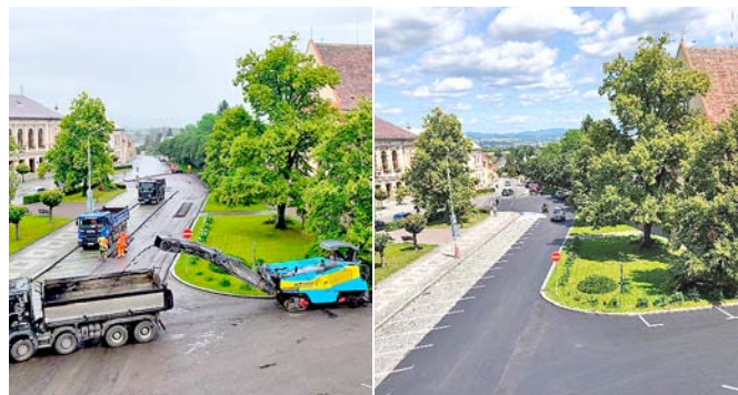
V pondělí ráno a v pátek odpoledne.

V pondělí 16. června 2025 byla zahájena plánovaná oprava místní komunikace na Kupkově náměstí, kterou realizovala společnost SWIETELSKY stavební s. r. o. Již následující víkend byl na náměstí obnoven běžný provoz včetně možnosti parkování na nově vyznačených plochách.