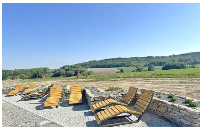
Nová relaxační zóna láká k posezení.

Vážení souseďe, s potěšením vás informuji o dokončení stavebních prací na novém veřejném prostranství v naší obci Semechnice, které realizovala firma V-work s. r. o. Na východním okraji obce, nad lokalitou nových rodinných domků, na vrcholu Římského kopce, vznikla odpočinková a relaxační zóna, která nabízí prostor pro klidné trávení volného času v přírodě.