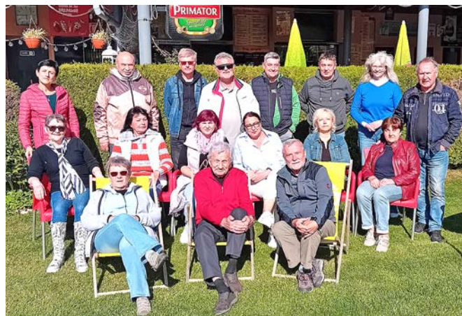
Společné vzpomínání na opočenském koupališti.

Tyto hospodářské výsledky nám umožnily splácet úvěr na přestavbu ve výši 8,5 mil. Kč tak, že jsme byli v roce 1989 vyhodnoceni jako jedni z nejlepších středisek v kraji. Za odměnu nám byla udělena dotace na vybudování zahradní restaurace. Projekt, na kterém jsme pracovali celý rok, však už nemohl být realizován. Přišla totiž první rána pro hotel v podobě p. Koudelky. Pak druhá rána. To, když vedení města nesehnalo odvahu a 7 mil. Kč na jeho koupi. A tak přišla třetí a poslední zkáza hotelu. Právě ve dnech čtyřicátého výročí otevření se poslední majitel rozhodl zlikvidovat sál a přestavět ho k jiným účelům.