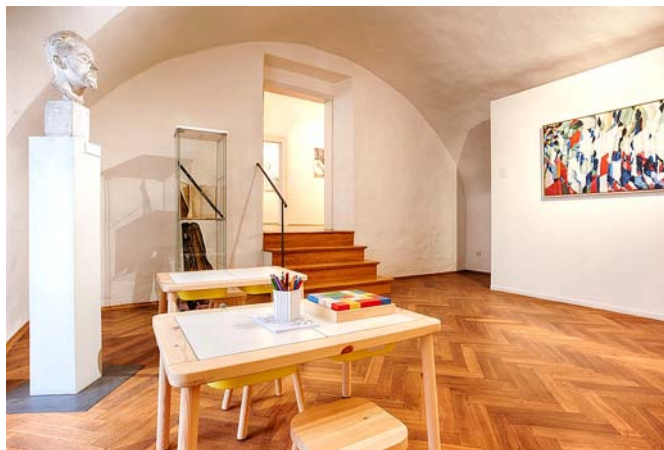
Městské výstavní síně zvou malé i velké návštěvníky k objevování historie i umění hravou formou.

Součástí expozice je i interaktivní hra – pátrání po Kosmově kronice, v níž se nachází první písemná zmínka o Opočně.