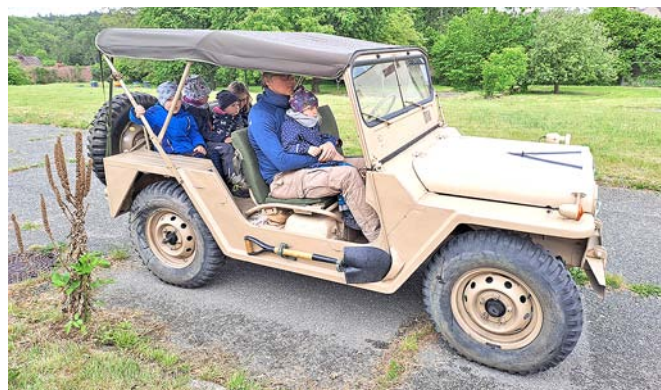
...a mohly se i projet.

Radost nám naopak neudělalo počasí, které z účinkujících v průběhu dne udělalo „zmožené ovce“ (ano, většina dobových uniforem je vlněných). I přesto se v dopoledních hodinách stihlo pár desítek dětí projet historickou technikou po klášterním trávníku. Jednalo se vlastně o rekonstrukci události, jelikož v květnu 1945 se v klášterních zahradách uskladoval zabavený materiál.