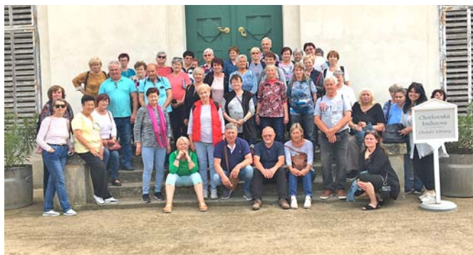
Společný výlet na zámek Kačina.

V hřebčíně nás průvodci necelé tři hodiny vodili po rozsáhlém areálu a vyprávěli nám o chovu kladrubských koní, zavedli nás do muzea kočárů a také na zámek. Abychom vše zvládli, byli jsme rozděleni na dvě skupiny a dozvěděli jsme se mnoho zajímavostí. Viděli jsme koně v ohradách, ve stájích, koně zapřazené ve vozítkách a také při výcviku. Pilně se o ně starají nejen zaměstnanci, ale také učni.