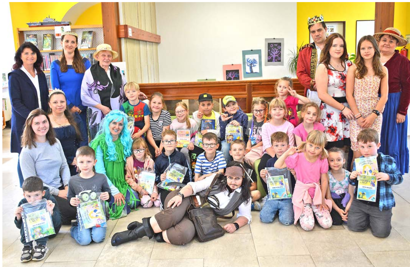
Ke konci školního roku patří i tradiční pasování prvňáčků na čtenáře. Malí čtenáři složili slavnostní slib, kterým se zavázali, že budou ctít slovo, ochraňovat knihy a statečně se bít za všechno dobré, co je v nich napsáno.

Noviny pro kulturní a společenský život Opocna