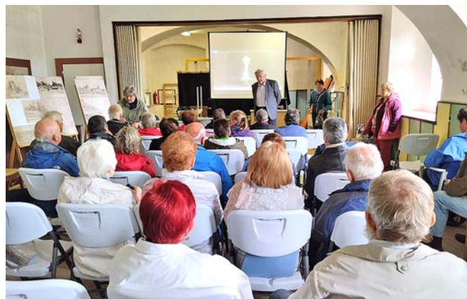
Senioři z Opočenska si v klášterním refektáři vyslechli poutavou besedu o záchranné službě a krizovém řízení.

V květnu se senioři vydali vlakem do Poděbrad, kde se prošli krásně upraveným lázeňským parkem až k přístavišti, kde nastoupili na palubu výletního parníku k vyhlídkové plavbě po Labi k jeho soutoku s Cidlinou. V přátelské besedě tam strávili příjemné odpoledne. Při dalším výletě, který pořádala NATURA Dobré – Hlinné, navštívili lyžařský areál v Lomnici n. P. se skokanskými můstkami a vrch Tábor s rozhlednou a křížovou cestou. Po příjezdu na vrch Tábor se účastníci rozdělili do dvou skupin, ti zdatnější absolvovali 6 km dlouhou túru ke skokanským můstkům a vystoupili i na vyhlídkovou věž nad můstkami, odkud byl krásný výhled do okolí. Ostatní si prohlédli okolí rozhledny včetně umělé nory, prošli krásnou křížovou cestou s poutním kostelem a pak je autobus dovezl ke skokanským můstkům, kde se všichni sešli a po prohlídce areálu zašli na výborný oběd do místní restaurace. Odpoledne pak navštívili muzeum se spoustou zajímavých exponátů, které potěšily zejména milovníky historie. Výlet se opravdu vydařil a všichni si odnesli hezké zážitky.