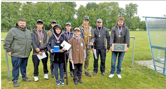
Družstvo mladých rybářů z Opočna obsadilo třetí místo a navázalo na úspěchy z minulých let.