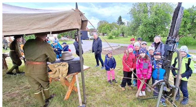
Děti se při výkladu o květnových událostech 1945 seznámily i s výzbrojí tehdejších vojáků...