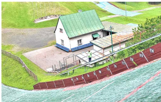
Skokanské můstky v Lomnici nad Popelkou nabídlý nevšední výhled.

i o své pedagogické činnosti. Své vyprávění doplnil prezentací fotografií a zpestřil i úsměvnými perličkami z vyšetřovacích spisů. V závěru besedy ochotně odpověděl na zvědavé dotazy přítomných.