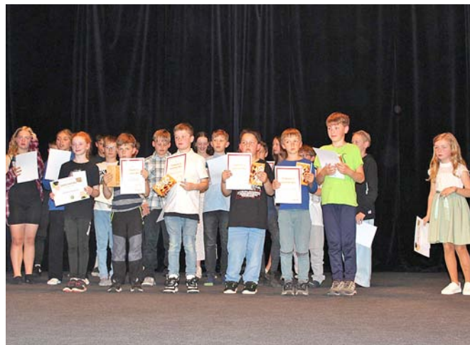
Závěr akademie patřil ocenění žáků, kteří školu reprezentovali v soutěžích a mimoškolních aktivitách.

Bylo vidět, že děti si to užívají. Byli jsme dojatí i pobavení. Největší radost máme z toho, jak se do příprav zapojili i ti, kteří běžně nevystupují.