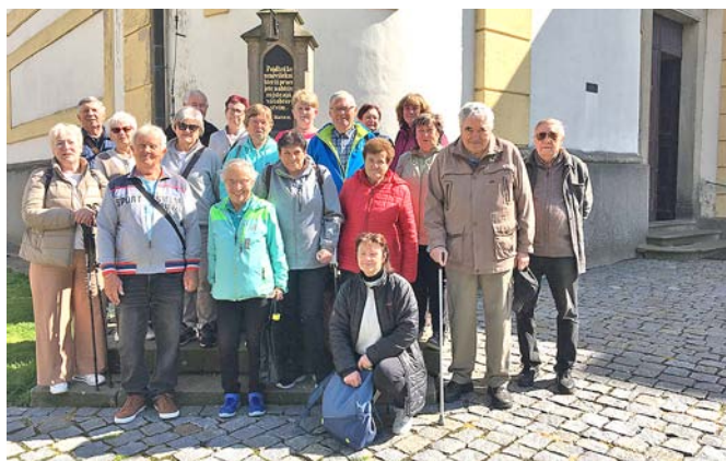
Členové organizace si komentovanou prohlídku při Noci kostelů užili.

vyprávěl o historii a výzdobě kostela. Současná podoba našeho děkanského chrámu s křížovou klenbou je z roku 1567, kdy Vilém Trčka z Lípy nechal přestavět původní zámeckou kapli svatého Ondřeje. Kostel nese deset sloupů a se zámkem je spojen chodbou.