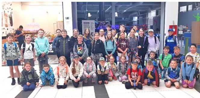
Za nasbíraný papír si děti ze školy užily zábavu v Toboga Jump.

V pondělí 2. 6. 2025 se čtyřicet nejlepších sběračů ze všech tříd naší Základní školy Opočno vydalo na exkurzi do zábavního centra Toboga Jump v Hradci Králové. Exkurze byla odměnou za nasbírané kilogramy starého papíru.