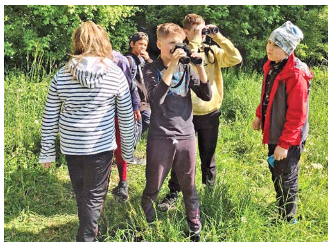
Žáci během vycházky pozorovali přírodu v okolí rybníka Broumar pomocí dalekohledů a poznávali její rozmanitost přímo v terénu.

Ve středu 14. května se žáci 4. tříd vydali na přírodovědnou vycházku k rybníku Broumar. Cílem bylo nejen projít se krásnou krajinou v okolí města, ale především pozorovat přírodu přímo v terénu – tak, jak ji běžně ve školních lavicích nezažijí.