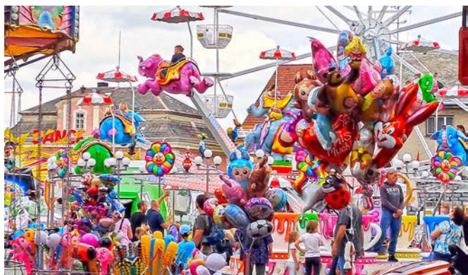
I přes dešťové přehánky se na pouti v Opočně roztočily kolotoče, rozsvítila světylka a zněl smích dětí i dospělých.

Kolaps návštěvníka akce, kterého po dlouhé cestě ze zahraničí přivedla dehydratace do rukou záchranářů, byl řešen hned v pátek večer. Naštěstí s dobrým koncem. O další adrenalinový zážitek organizátorů se postarala omladina, která usoudila, že zábava se náležitě rozproudí pouze s pořádnými promilemi v krvi. Jeden z nezletilých, ležíc na chodníku mezi několika dávkami zjevně nestrávených asijských nudlů, si tu srandu pak po převozu do nemocnice zajisté užíval ještě dalších několik dní. A jeho rodiče patrně také. Nedělní odpoledne zase nečekaně zpestřil příjezd policejních složek, které převzaly z rukou zástupců security místního narušitele (slušně řečeno), zpacifikovaného poté, co vyhrůžky malým dětem doplnil fyzickým útokem. Obratem byl převezen na záchytku. Další incident proběhl před vystoupením Heidi Janků, kdy se jeden z účastníků soutěže v pití tupláků dožadoval podpisu umělkyně a odmítal pochopit, že musí počkat až po vystoupení. Vše vyřešila přítomná ochranka.