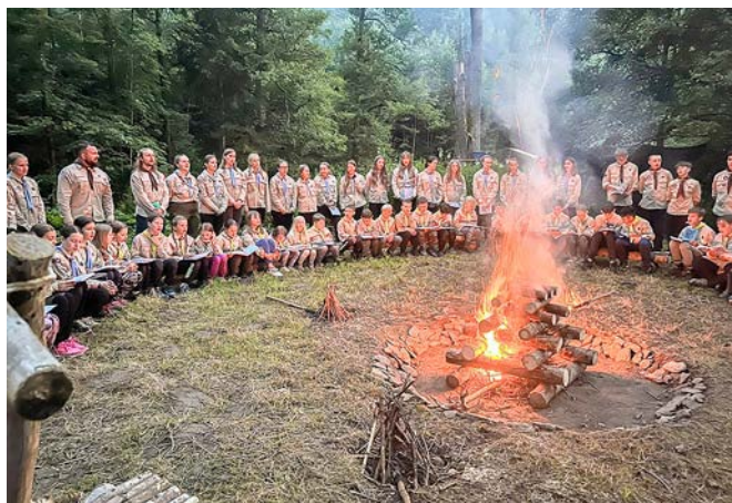
Večerní setkání u ohně patří k nejkrásnějším okamžikům tábora.

Letošní skautský tábor v malebném prostředí Maršova byl plný zážitků, dobrodružství a kamarádké atmosféry. I když nám počasí občas připomínalo, že léto umí být i deštivé, dobrou náladu nám žádný liják nezkažil.