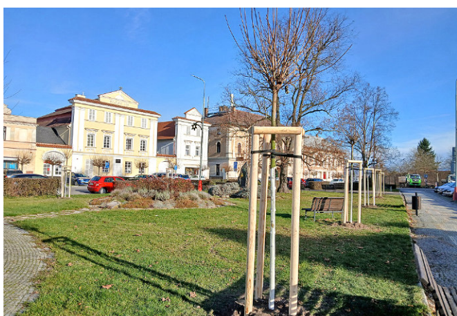
Kupkovo náměstí už zdobí nově vysazené stromy.

V druhé polovině listopadu proběhlo ve středové části Kupkova náměstí pokácení deseti starých kulových javorů. Za stromy, které byly ve špatném zdravotním stavu, bylo vysazeno patnáct nových stejného druhu.