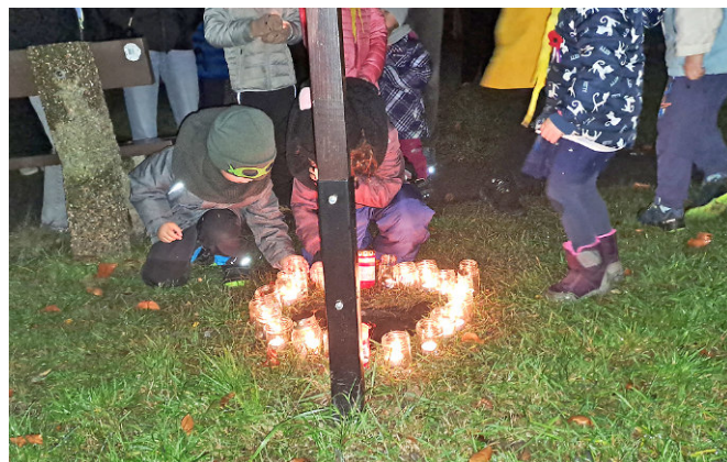
Nejmenší účastníci pietního setkání pokládají svíčky u památné lípy na připomínku 17. listopadu.