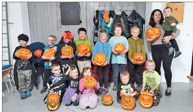
Děti a jejich jejich výtvořky

Letošní rok jsme dýňování uspořádali 31. října, přesně na Halloween. Celkem 13 dětí se svými rodiči se sešlo v podvečerních hodinách v hasičárně. Děti si vybraly dýni a společně s rodiči tvořily výtvořky. Jak se jim to povedlo, se můžete podívat na přiložené fotografii.