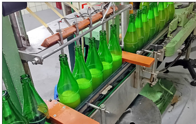
Moštovací linka měla letos napilno.

Opočenská moštárna se po dvou letech živoření, kdy jsme pro malou úrodu jen udržovali chod a snažili se každé jablko zpracovat co nejefektivněji, konečně mohla rozjet a lisovat na plné pecky. Odpusťte mi toto slovo, ale jinak letošní chod moštárny se nazvat nedá. Provoz byl každý den včetně sobot nedělí. Každý den odpoledne vylišovat přivezená jablka, přes noc nechat ustát. Druhý den ráno stočit podle požadavku do lahví nebo Bag in boxů, všechny cesty, kudy protéká mošt, vyčistit, nastavit cesty do výroby a ve 13 hodin již opět lisovat další dávku. Za den zpracováváme asi 3.500 kg jablek, záleží na výtěžnosti. Omezuje nás velikost sedimentační nádrže, ve které vylišovaný mošt odpočívá a čistí se do rána. Celkem nám bylo přivezeno 114.059 kg jablek.