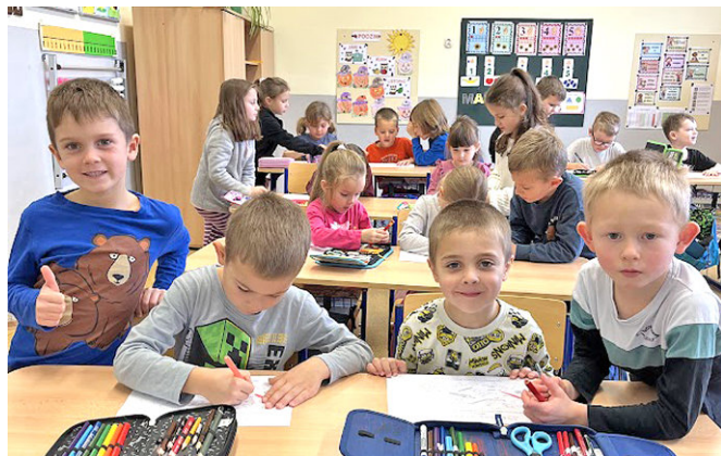
Předškoláci si vyzkoušeli, jaké to je sedět ve školních lavicích.

V úterý 11. listopadu se naše škola otevřela zvědavým předškolákům, kteří si přišli poprvé prohlédnout, jak to v opravdové první třídě vypadá. Pod dohledem starších kamarádů si s nadšením vyzkoušeli práci školáka, seděli v lavicích a plnili malé úkoly. Naši pilní prvňáci se role průvodců zhostili s velkou ochotou a trpělivostí, a hrdě ukazovali, co už se naučili.