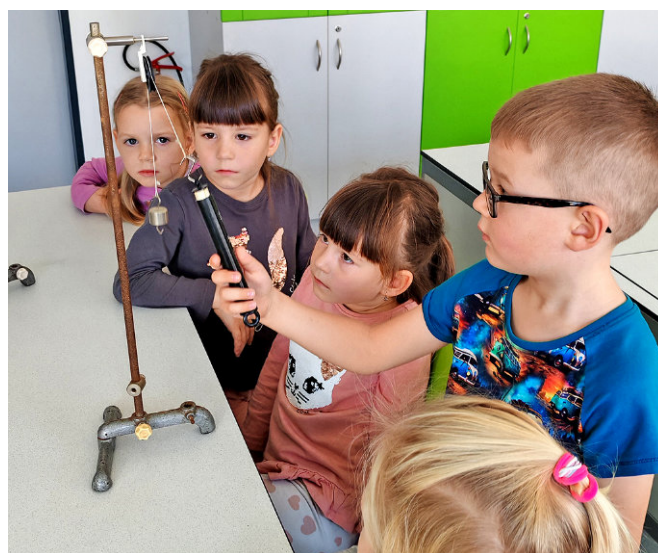
Předškoláci ze Včeličkové třídy zkoumají jednoduchý fyzikální pokus během návštěvy základní školy.

Velkým zážitkem bylo také seznámení s fyzikou hravou formou – děti zkoumaly principy optiky, tření, páky a kladky. Nadšeně objevovaly, jak věda funguje v praxi, a s chutí se zapojovaly do všech aktivit.