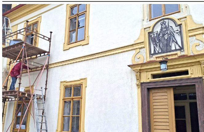
Nová okna jsou věrnou kopií původních.

Budova fary na Trčkově náměstí je jednou z mála národních kulturních památek, které jsou v našem městě. Je to nejvyšší památková ochrana, stejná jako má např. zámek.