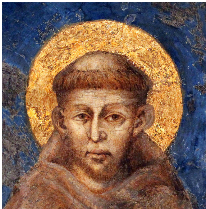
Cimabue – Sv. František z Assisi, patron Itálie; freska v horním kostele baziliky v Assisi