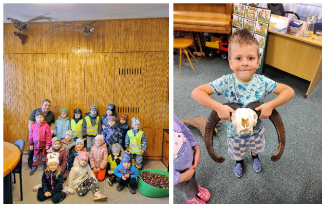
Děti z Motýlkové třídy zkoumají přírodniny, stopy zvířat a parohy během programu o lese a myslivosti.

Víte, co je to prožitkové učení? My ve školce ano a také ho v denním režimu využíváme. To, co děti vidí ve svém přirozeném prostředí, na co si mohou sáhnout nebo s tím manipulovat, v nich zanechává mnohem silnější dojem a prožitek, než kdybychom jim jenom četli, vyprávěli nebo ukazovali obrázky.