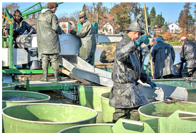
Rybáři během tradičního výlovu Broumaru

ráno začala první shánka ryb. Rybáři se při ní vydali nad loviště a snažili se co nejvíce ryb nahnat na podložní síť. Pomalu postupovali rybníkem od Zárybnice směrem k hrázi a bouchali při tom do vody „klikami“ tak, aby se co nejvíce ryb podařilo dostat na podložní síť. Po zvednutí podložní sítě se jako první vybírali dravé druhy ryb, jako jsou štiky a candáti, následně došlo také na kapry a amury, kteří se vyndávali ze sítě pomocí velkého mechanického keseru a následně se na brakovacím stole třídili podle druhů a velikostí. Za oba dva dny se tento postup opakoval několikrát. Letošní kapři měli průměrnou hmotnost kolem 3 kg a celkově se z Broumaru vylovilo přes 40 tun ryb.