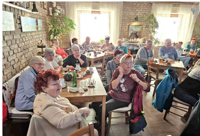
Účastníci setkání si užívají společně odpoledne.

A my hádali, která dvojice je právě na fotografii. Následovalo vyloužit slova podle různých obrázků, a i když to někomu déle trvalo, všichni nakonec slova dobře napsali. Paní starostka pak losovala ze správných odpovědí výherce drobných cen.