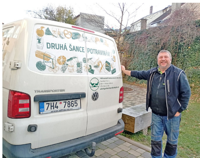
Pracovník potravinové banky přebírá potraviny určené k dalšímu rozdělení.

Ve dnech 23.–24. 10. 2025 probíhala na naší škole v rámci projektu Cesta k sobě a k druhým, který byl podpořen Královéhradeckým krajem, sbírka do potravinové banky. Veškeré vybrané potraviny byly 7. 11. 2025 předány do Potravinové banky Hradec Králové, která předá potraviny potřebným. Celkem se vybralo krásných 130 kg potravin, což je více než v loňském roce.