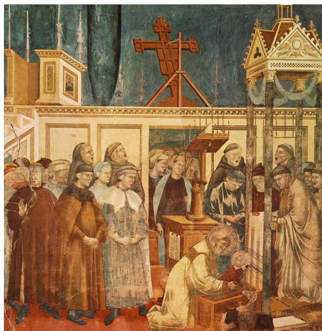
Giotto – Jesličky v Grecciu, legenda o sv. Františku

Miniaturní betlémy známe zhruba od počátku 17. století. Objevují se uvnitř bohatě zdobených ebenových kabinetů, domácích oltářků manýristické doby. Po jejich otevření se ukázala drobná scéna narození Krista se stříbrnými nebo slonovinovými figurkami. K prvním známým tvůrcům patřil zlatník Abraham Lotter z Augsburgu. Některé jeho práce se dochovaly například v Mnichově nebo v loretánském poutním místě v Praze na Hradčanech. Po Tridentském koncilu se betlémy začaly ve větší míře objevovat v chrámech – zvláště v 17. a v první polovině 18. století. Velkou zásluhu na tom měli řeholníci, a to především františkáni, kapucíni a servité.