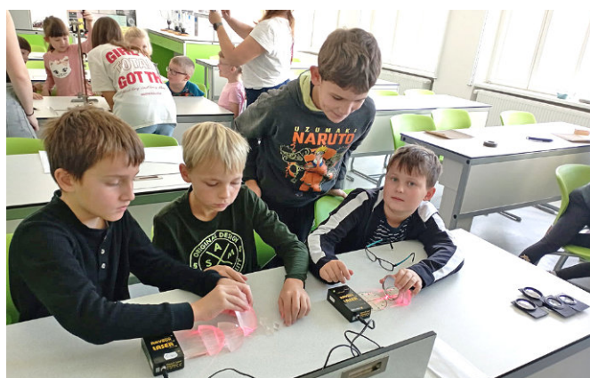
Starší žáci pomáhají mladším dětem při fyzikálních pokusech během projektového dne.

V pátek 7. 11. 2025 jsme v naší základní škole přivítali opět děti z partnerských mateřských škol z Opočna (6) a Pohoří (5) a základní školy z Pohoří (4) v rámci udržitelnosti projektu Škola pro všechny.