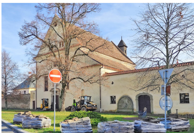
Práce na opravě chodníku před areálem kláštera

Společnost Dlažba Vysoké Mýto s. r. o. provádí opravu chodníku před areálem kláštera na Kupkově náměstí. Nový chodník z pískovcové dlažby by měl být podle informací z odboru majetku a rozvoje města hotový do konce roku.