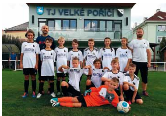
Díky firmě Atas elektromotory Náchod a.s. a LION Sport nastupují mladší žáci v nových dresech se sloganem "Pohyb je náš život".