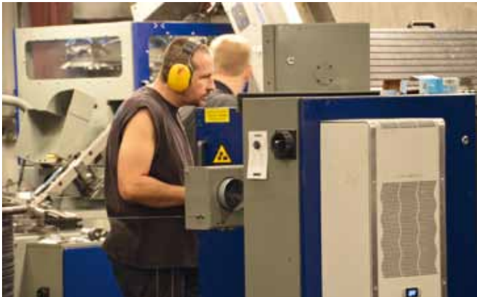
Zprovoznování a zaškolení obsluhy nové technologie ve výrobě Hašpl.