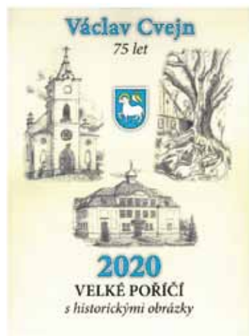
Nástěnný kalendář 100,- Kč