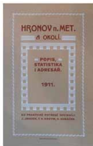
Kniha o našem regionu 175,- Kč