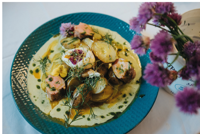
Honza Bartoň/MAS Stolové hory