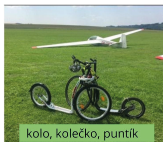
kolo, kolečko, puntík