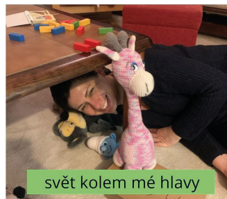
svět kolem mé hlavy