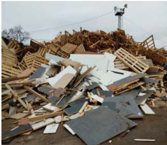
Dřevo určené k recyklaci