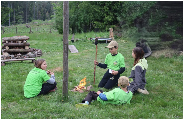
chata Kamzík, před zapálením slibového ohně