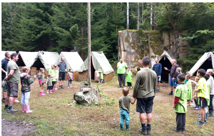
Tábor Libná, při nástupu