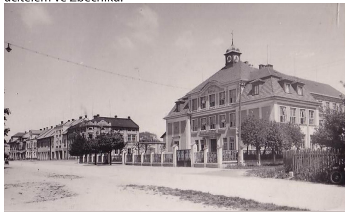
Základní škola Velkého Poříčí - tého času

Rozsával po svém okolí vždy jen dobro, kolegové ho měli velmi rádi, jelikož byl milým přítelem, soužití s ním bylo přátelské a milé. Staral se o školní zahradu (hlavně o stromy a pěstování zeleniny a ovoce). Dne 31. ledna 1927 ukončil svou práci na dosavadní škole, na které 36 let působil a byl ustanoven řídícím učitelem ve Zbečniku.