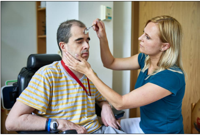
Posílíme řečové schopnosti i polykací svaly.