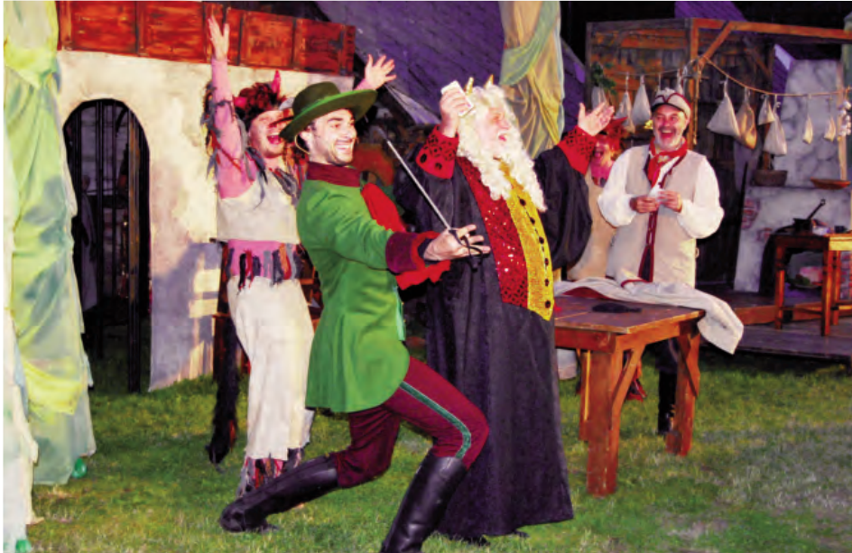
Hrátky s čertem v podání herců Městského divadla v Mostě.

Přiznávám se, že už na konci XIX. Poláčkova léta jsme spolu s Martinem Šedou byli rozhodnutí o některých titulech, které nesmí na jubilejním XX. ročníku chybět. Když jsme pár dnů po skončení našeho festivalu viděli na nádvoří zámku Hluboká nad Vltavou Casanovu, bylo nám jasné, že to musí být tečka letošní přehlídky – a podařilo se.