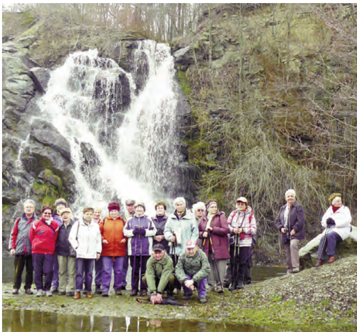
Výcházka klubu seniorů k vodopádu ve staré části lomu Masty.