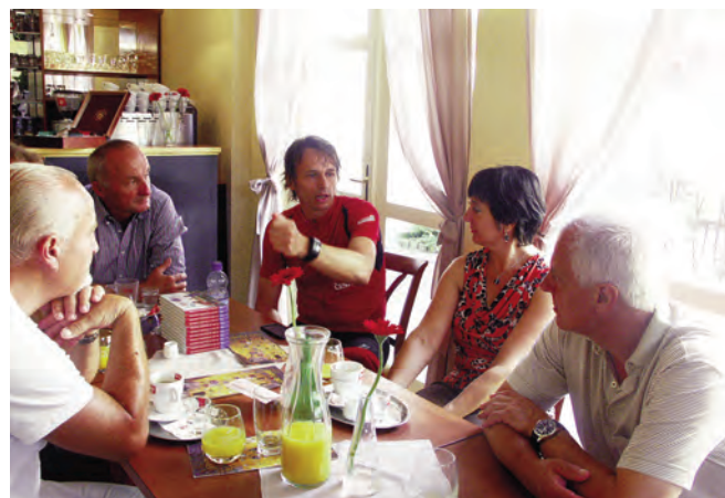
Europoslanec při návštěvě Rychnova nad Kněžnou.