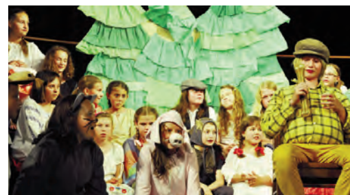
Hudební muzikál Zvířátka a loupežníci v podání Ptáčat

V nejbližší době čeká Carminu opravdu hodně práce. Na konci října odcestuje do španělské Tolosy, kde se zúčastní prestižní mezinárodní soutěže. Kromě soutěžního vystoupení odpívá 7 koncertů a bude mít možnost slyšet vynikající sbory z celého světa.