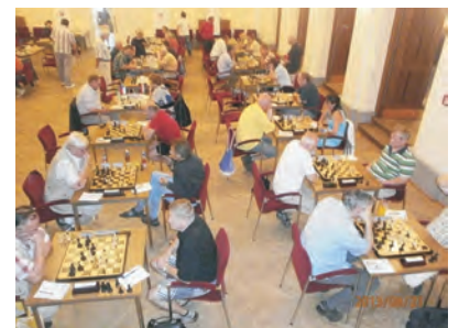
Pohled do hracího sálu v Pelclově divadle.