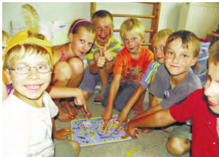
Příměstské tábory jsou plné zábavy a dobrodružství.

V září se rovněž mládež z Děčka účastní mezinárodní výměny na Slovensku, kde je pro všechny účastníky přichystán několikadenní program. Výměny se účastní za odměnu mládežníci, kteří během roku pomá-