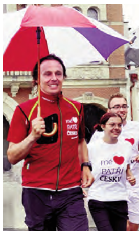
Edvard Kožušník na trati.

Zajímavý sportovní výkon mladého českého europoslance můžete pravidelně sledovat na www.kozusnik.cz nebo na jeho facebookovém profilu. man