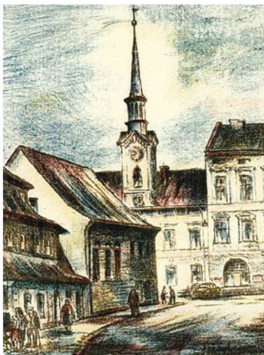
Grafika Jaroslava Kaisera z Čestného uznání