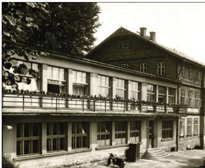
Lesnická škola v roce 1961

• Od 1.1.2008 ČLA Česká lesnická akademie Trutnov - střední škola, vyšší odborná škola