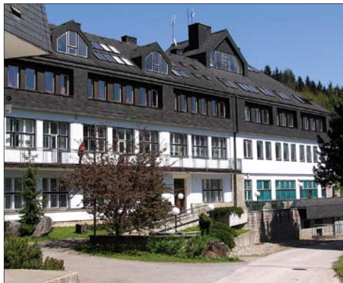
Lesnická škola dnes