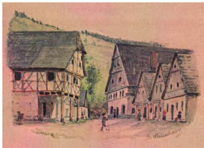
Obrázek B. Hauschnera z roku 1884