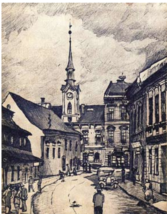
Ruch v centru poválečné Svobody nad Úpou na titulní straně telefonního seznamu Krkonoš z roku 1947