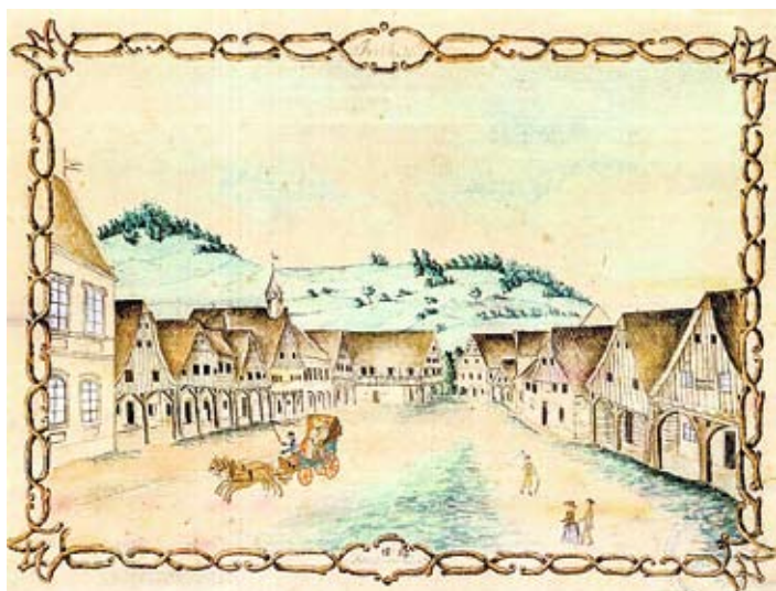
Svobodské náměstí v roce 1858