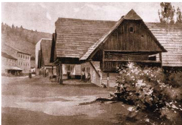
Reprodukce akvarelu z publikace Čechy – díl Severní Čechy 1908 – nakladatele Jana Otta