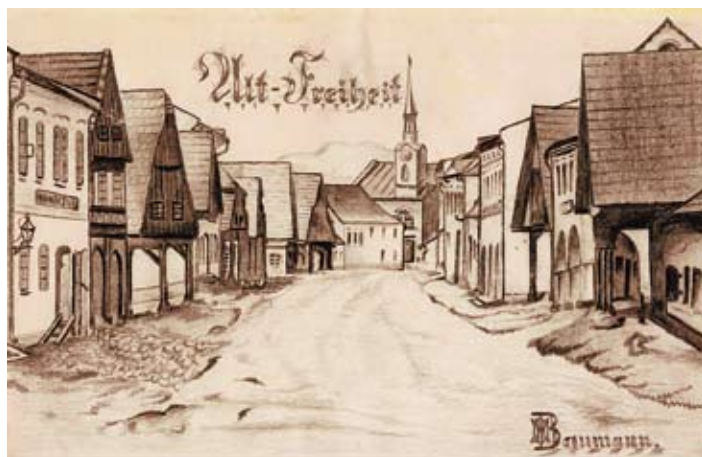
Stará Svoboda nad Úpou z konce 19. století