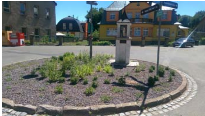
Prostor kolem „meteostanice“ u školky – tento prostor byl na podzim osázen vybraným lučním kvítím a okrasnými travinami a letos na jaře už jsou první rostlinky na světě.

I tento květináč byl krásně barevně osázen ve stejném duchu jako všechny ostatní po obci, ale nevydržel více jak týden a nějaký nenechavec za bílého dne jej zplnil a většinu letniček vytrhal. Tentokrát měl kliku, že jej nikdo neviděl, ale příště ji možná mít nebude. Je to škoda, snažíme se udělat veřejné plochy hezčí a naše město alespoň trochu vyzdobit pro všechny a tak prosíme občany, aby otevřeli oči a výzdobu si chránili a pomohli nám ji udržet co možná nejdéle. Děkuje.