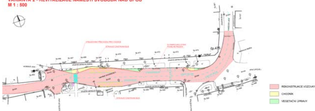
REKONSTRUKCE SILNICE III/2961 VARIANTA 2 - REVITALIZACE NÁMĚSTÍ SVOBODA NAD ÚPOU M 1 : 500