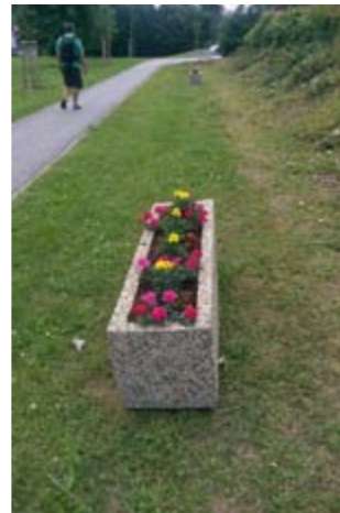
Pod domem rodiny Popelkových

Všem ještě jednou moc děkujeme za pomoc při zálevání květinové výzdoby ve městě.