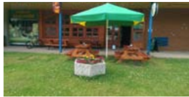
Před AQUA barem v Rýchorce