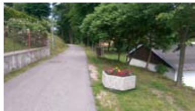
Na křižovatce ve Staré aleji u Kyselových