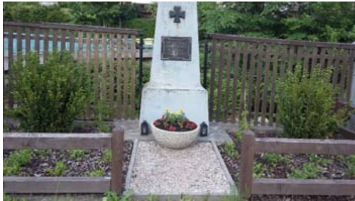
Před mostem na Nový svět u povodňového pomníku – o tento květník se stará paní Míša Špetlová