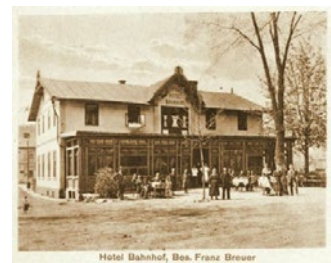
Bílý kůň na propagační pohlednici obvykle nemohl chybět / I personál se rád vyfotil – detail z okénkové pohlednice / Hostům sloužila i prostorná předzahrádka