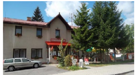
Po ubourání verandy zůstal jen přístřešek nad vchodem / Hotel Sport na fotografii Pavla Klimeše z roku 1995 / Jedna z posledních fotografií před rekonstrukcí