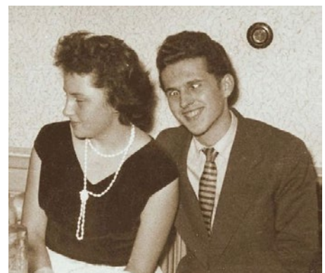
Porcelánový štítek na dveře nějakého Josefa Breuera / Náhrobní deska manželů Breuerových na hřbitově ve Svobodě nad Úpou / Může se té Lidě někdo divit, že neměla zájem?