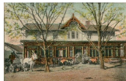
Hotel „Stadt Bremen“ na detailu z historické pohlednice / Před nádražím bývalo rušno / Breuerův hotel se vyznačoval charakteristickou prosklenou dřevěnou verandou