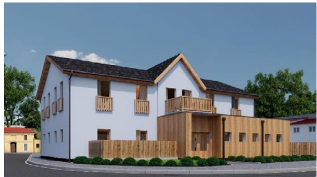
Generální přestavba před dokončením / „Rezidence Sport“ - reklamní vizualizace