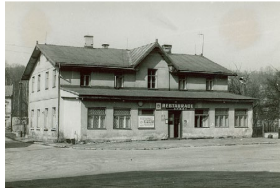
Nový majitel Josef Breuer na vzhledu budovy nic neměnil / Hotel Sport za mládí mé generace