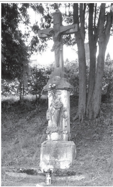
umístění pod hřbitovem