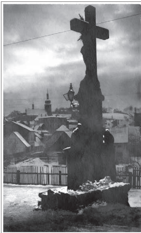
umístění pod Skalkou