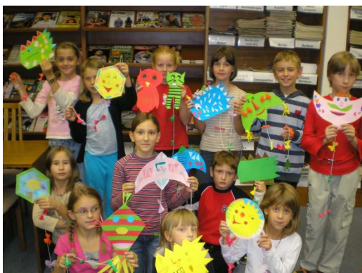
Dračí nocování v listopadu