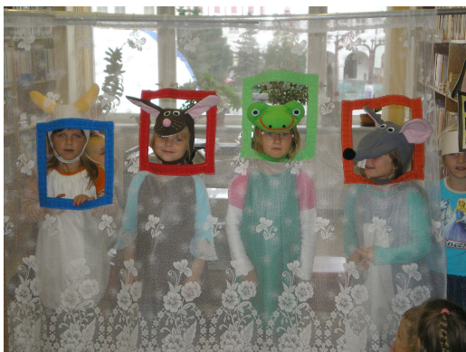
Návštěva dětí z mateřské školky