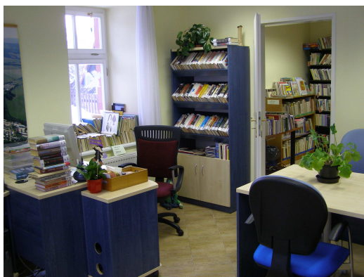
Knihovna v Prostředním Lánově

Servis výpočetní techniky poskytujeme knihovnám, které používají knihovnický systém LANius a Clavius a nově také program Clavius REKS. Na našem okrese se jedná o 36 knihoven, kterým jsme aktualizovali program, pomáhali se zprovozněním programu nebo uložením jejich kmenového knihovního fondu do databáze (celkem jsme uložili 23700 knihovních jednotek). Tyto katalogizační záznamy jsme následně opravili nebo doplnili. Do konce roku bylo již 20 „reksových“ knihoven schopno spustit plně automatizovaný výpůjční protokol.