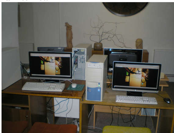
Nový prostor s internetem pro děti

V roce 2009 bylo vybudováno díky městskému bytovému podniku informační pracoviště s přístupem na internet v oddělení pro děti. Byly odstraněny papírové a dřevěné výplně mezi oblouky v chodbě knihovny a přesunuty dveře. Tím se nevyužitá místa před ředitelnu stalo součástí oddělení pro děti, kde jsou umístěny 4 počítače s přístupem na internet.