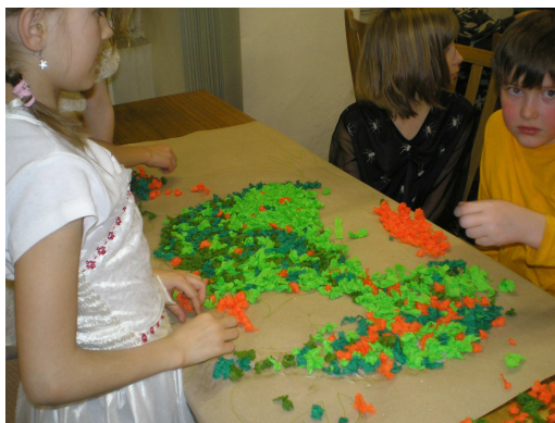
Dračí spaní v dubnu