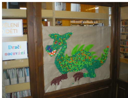
Práce dětí z dračích nocování

Další významnou akcí bylo nocování v knihovně. Poprvé to bylo „Dračí spaní“, které se uskutečnilo v dubnu a kde děti vyráběly dračí rodinu. Druhé se konalo v říjnu a jeho název byl Nocování s drakem. Celý večer jsme si hráli a povídali se strašidly, četli dětské horory apod.