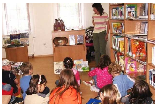
Knihovna v Batňovicích

Během roku byly uspořádány dvě porady pro profesionální knihovníky. Hlavními tématy opět bylo zapojení knihoven do benchmarkingu (porovnávání dat knihoven celé republiky) a nové statistické výkaznictví pro rok 2009. Dále pak informace z jednotlivých knihoven a pomoc při řešení jejich problémů. Jedna porada se uskutečnila ve MěK Svoboda nad Úpou, která je po celkové rekonstrukci.