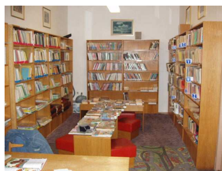
Knihovna v Prosečném