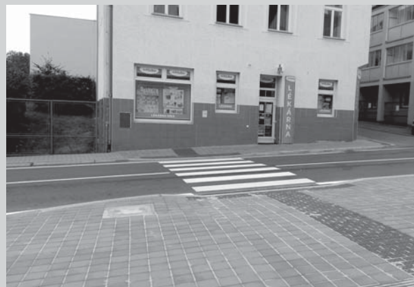
...což ale z pohledu chodce není vůbec špatně.