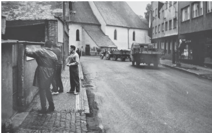
Vylepování protiokupačních plakátů v Rychnově n. Kn.

I Rokytnici v Orlických horách zasáhla invaze, a to v plné míře. Obsazena byla nejdříve polskou okupační armádou. Tu později nahradila vojska sovětská. Ve městě přistál z důvodu