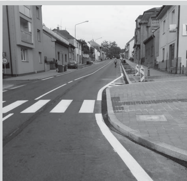
Vystupující část přechodu do vozovky nutí řidiče zpomalit...