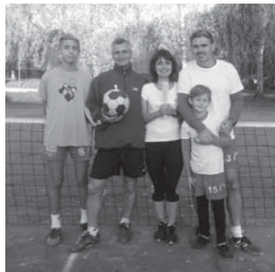
Vítězné turnaje Otec & Syn.