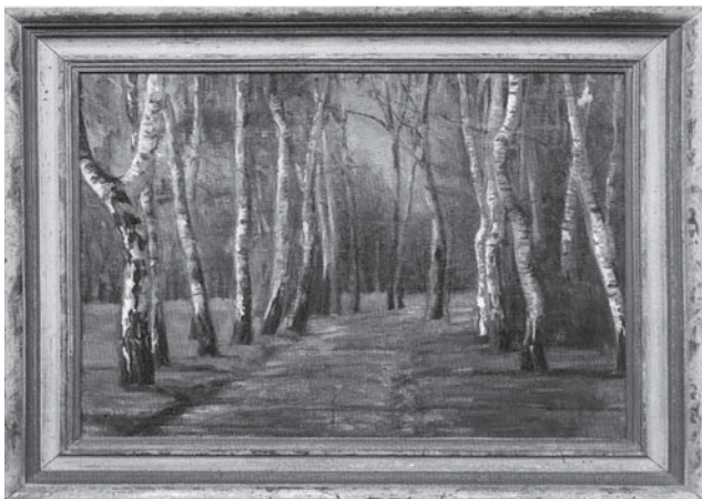
Název obrazu „Podzim v parku“