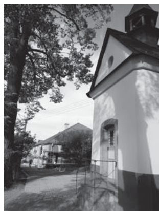
Školka a kaplička leží stranou hlavní silnice, přesto tvoří přirozený střed Merklovic.

vě vnějšku budovy a celkovému zatřídění prostředí. Rozpočet akce je cca 900 tisíc korun, z toho příspěvek Královéhradeckého kraje tvoří polovinu potřebné částky.