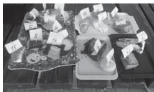
Kulinářská soutěž nabídla opět pestrou výběr pochutin.