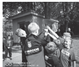
Žáci se radují z vítězství v krajském přeboru.

Jménem nohejbalového oddílu bychom chtěli poděkovat městu Vamberk za podporu tělovýchovné činnosti v Pekle nad Zdobnicí. Díky podpoře města letos vedle běžné sportovní činnosti proběhla rekonstrukce sportovního areálu a byl také uspořádán zdařilý šampionát starších žáků.