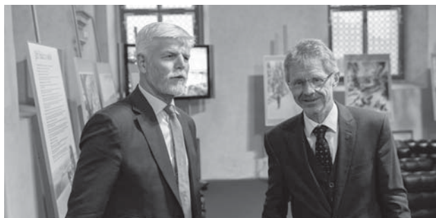
Týden po otevření navštívil výstavu v doprovodu předsedy senátu Miloše Vystrčila i prezident republiky Petr Pavel.