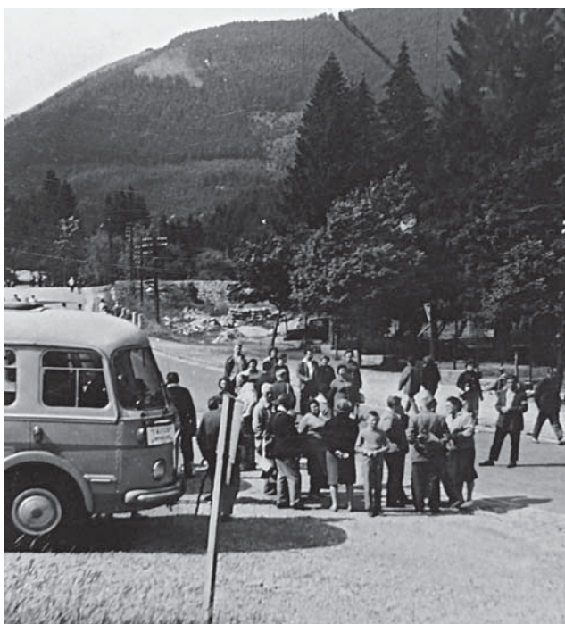
Skupina výletníků u autobusu v Peci pod Sněžkou