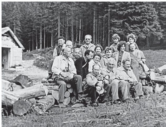
Výletníci v Obřím Dole

v Kulturním programu města Vamberka. Současně někteří z členů podnikali i cykloturistiku (první zmínka v kronice 1971), zimní turistiku, výkonnostní turistiku a vysokohorskou turistiku. Největší oblibě se těšily autobusové zájezdy. První autobusové zájezdy proběhly okolo roku 1962 a byly pořádané ve spolupráci s místním podnikem ŽAZ (podnikovým autobusem za úhradu pouhé režie). Protože původní místní odbor svou činnost v roce 1955 ukončil a ke znovuzkřížení vamberské turistiky došlo až ustavením turistického odboru při TJ Baník Vamberk v roce 1964, konaly se tyto zájezdy v mezidobí, kdy turistika v našem městě nebyla organizována