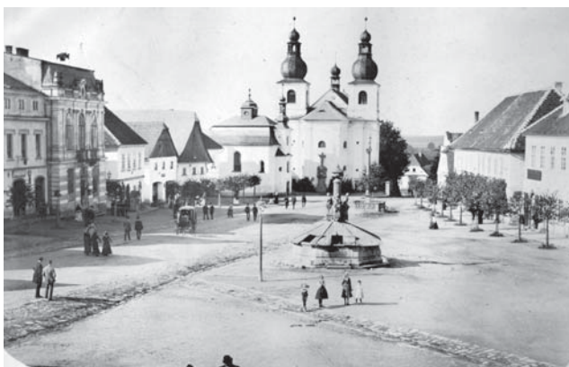
Vamberecké náměstí závěru 19. století bylo svědkem přeměny podhorského městečka s roubenou zástavbou na moderní průmyslové město