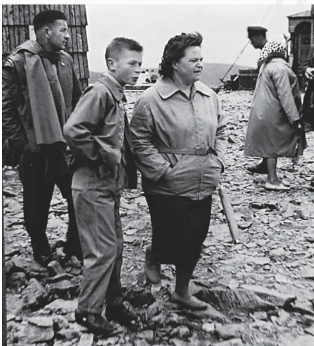
Momentky ze Sněžky