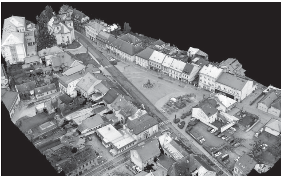
Podkladem pro zpracování studie je prostorový 3D model, pracující s mračením miliard geodeticky zaměřených bodů