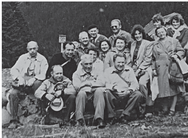
Výletníci nad Obřím Dolem