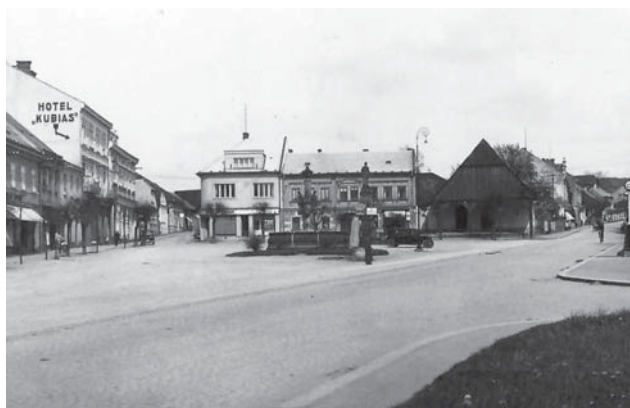
Třicátá léta přinesla na Husovo náměstí řád a přehlednost. Dopravní zátěž v té době však byla zanedbatelná.

Dotazník najdete v elektronické podobě na www.vamberk.cz v sekci Aktuality. Doručit jej můžete též písemně na adresu městského úřadu (do schránky na dveřích vedlejšího vchodu, na podatelnu (přízemí) nebo sekretariát (1. patro))