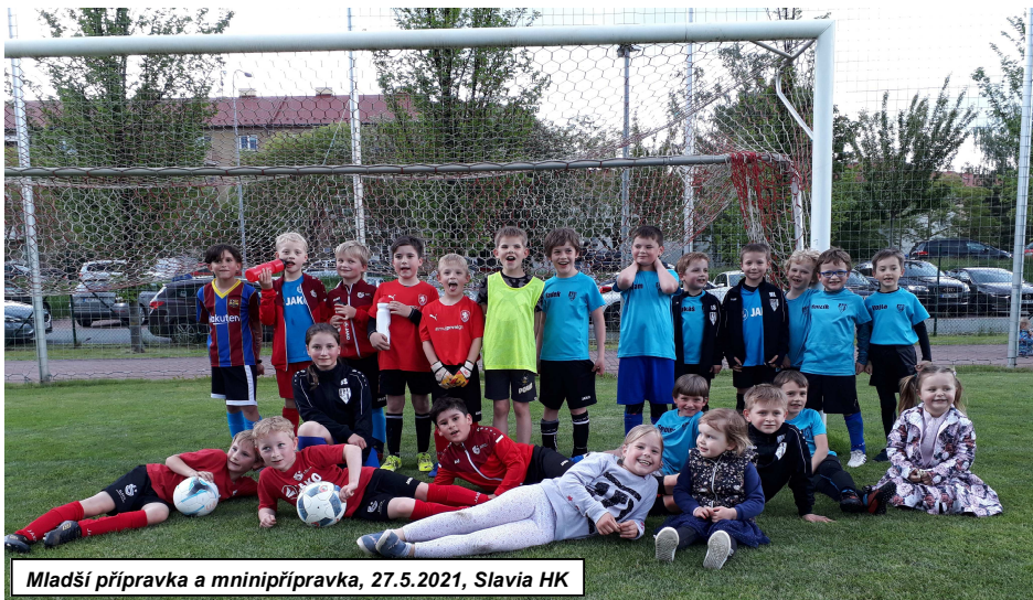
Mladší přípravka a minipřípravka, 27.5.2021, Slavia HK

Tak se nám rozběhla tréninková sezóna a můžeme běhat venku po našem krásném trávníku! Doba bez zamáčknuté kopačky do trávníku byla již dlouhá. Při dodržování nezbytných podmí- nek se začaly tréninkové proce- sy opět vracet do normálu. 😊 Jsme potěšeni, s jakou chutí a s jakým nasazením naši hráči k tomu přistupují. Také kolektiv, který všem dětem moc chyběl, se po dlouhé „době telefonů a počítačů“ začíná opět stmelovat. Tréninky jsme pojali jako přípra- vu na další sezónu. Na každý týden mají chlapi a děvka domluvená přátelská utkání. Je potřeba se rozehrát a naučené signály opět přenést do hry. Během tréninků hráči sami