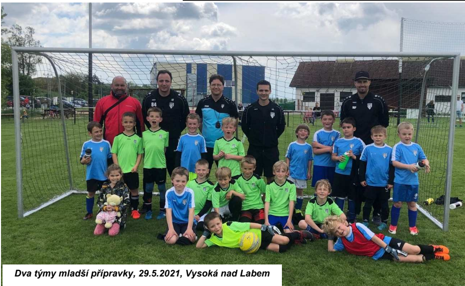
Dva týmy mladší přípravky, 29.5.2021, Vysoká nad Labem