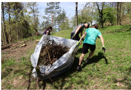
Úklid ořezaných větví v provedení Jaro Jaroměř

Již delší čas spolupracujeme v tomto ohledu se společnostmi Jaro Jaroměř ( https://www.jarojaromer.cz/ ) a Pestré polabí ( https://www.pestre-polabi.cz/ ). Naší snahou je obnovit původní ráz svahu, který je evidován od 70. let 20. století jako přírodovědecky a entomologicky cenná lokalita. Bohužel, v uplynulých desetiletích došlo ke spontánnímu zalesnění lokality, která v minulosti byla zcela bez stromů. Podle kroniky zde byla dokonce obecní pastvina.