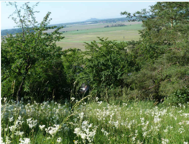
Stráň Milíře prokvetlá bílými třapci tužebníku obecného

V polovině června stráň rozkvetla vyššími bílými květy s výraznou, ne úplně příjemnou vůní. Jedná se o tužebník obecný ( Filipendula vulgaris ), což je léčivka, využívaná v lékařství pro antibakteriální a močopudné účinky, pro snížení horečky i k obkladům. Využívá se v kosmetice a dokonce býval důležitou složkou „nápoje lásky“ - odtud jeho název. Také nevěsty si ho prý dávaly do svatebních věnečků.